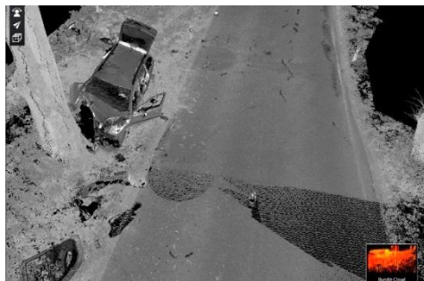
Ryc. 5. Skan miejsca wypadku – wyświetlenie na podstawie intensywności odbicia.

Ponieważ zasada działania skanerów laserowych 3D polega na emitowaniu wiązki laserowej i rejestrowaniu jej odbicia od powierzchni skanowanego obiektu, skanery do swego działania nie wymagają światła, zatem sporządzanie dokumentacji miejsca wypadku może być prowadzona nawet w zupełnej ciemności.