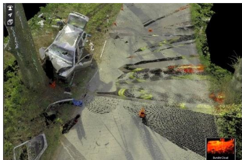
Ryc. 4. Skan miejsca wypadku – wyświetlenie z kolorami.

Dodatkowo ze względu na konieczność zobrazowania terenu z wielu miejsc, prawdopodobieństwo przekrycia tego samego miejsca jest stosunkowo niewielkie i poszczególne skany wzajemnie się uzupełniają. Końcowy skan (wynikowy) w takich przypadkach poddaje się procesowi czyszczenia (wyniki czyszczenia przedstawia ryc. 4), ponieważ podczas korzystania fotografii sferycznej otrzymana tekstura bywa przebarwiona poprzez poruszające się obiekty. Istotne ślady są jednak stale wychwytywane ze względu na intensywność odbicia ich powierzchni (patrz ryc. 5). Ponadto większość oprogramowania zawiera obecnie funkcje lub narzędzia do usuwania tych zbędnych danych.