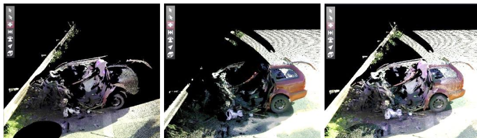
Ryc. 1. Łączenie wielu skanów w skan wynikowy.

Wynikiem pomiaru z zastosowaniem skanera laserowego jest tzw. chmura punktów, która obejmuje dziesiątki milionów precyzyjnie zdefiniowanych punktów pomiarowych w przestrzeni o zasięgu od kilkudziesięciu do kilkuset metrów. Jednocześnie w trakcie pomiaru, skaner umożliwia akwizycję obrazu sferycznego, co pozwala na uzupełnienie otrzymanej chmury punktów o informacje o kolorze. Ponieważ skaner jest w stanie uchwycić punkty tylko w bezpośredniej linii widzenia, skanowanie wykonuje się zwykle z kilku pozycji, a otrzymane chmury punktów są następnie łączone (ryc. 1).