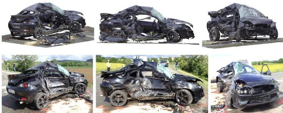
Ryc. 8. Pojazd w znacznym stopniu zdeformowany po wypadku drogowym (u góry skan 3D, u dołu zdjęcie pojazdu).

Uzyskana chmura punktów może być wykorzystana np. do określenia korelacji uszkodzeń, wysokości różnych otarć czy uszkodzeń karoserii pojazdu. Dokumentacja uszkodzeń pojazdów z wykorzystaniem skanera 3D (jak również ogólnie metod 3D) jest szczególnie przydatna w przypadku uszkodzeń całkowitych lub rozległych, gdy znalezienie referencyjnej, nieuszkodzonej części pojazdu, na podstawie której można dokonać pomiaru uszkodzeń, jest po prostu niemożliwe (ryc. 8).