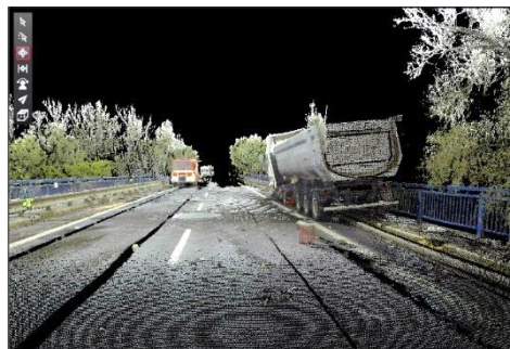
Ryc. 3. Miejsce wypadku – dokumentacja sporządzona podczas deszczu (skan 3D).