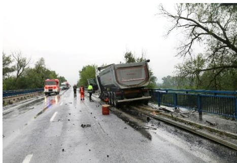
Ryc. 2. Miejsce wypadku – dokumentacja sporządzona podczas deszczu (dokumentacja fotograficzna).

W trakcie eksploatacji skanera sprawdzono również możliwości jego użycia w złych warunkach pogodowych, takich jak opady deszczu lub śniegu. Praktyka wykazała, że na proces skanowania nie mają wpływu lekkie opady deszczu lub śniegu i możliwe jest sporządzenie pełnej dokumentacji dowodowej miejsca wypadku oraz pojazdu biorącego w nim udział (ryc. 2 i 3).