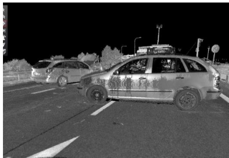
Ryc. 7. Skan 3D miejsca wypadku przy ograniczonej widoczności.