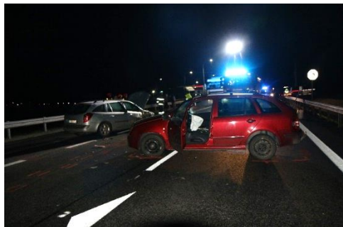
Ryc. 6. Fotografia przedstawiająca miejsce wypadku przy ograniczonej widoczności.