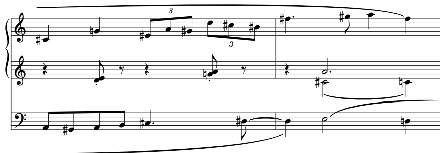
Przykład 8. Allegro scherzando , t. 100–106

Na umieszczoną w partii pedału melodię refrenu ronda nałożona została motywika pierwszego tematu formy sonatowej. Powstałe zagęszczenie fakturalne powoduje nieustanny wzrost energetyki formy, prowadzący do kończącej utwór kadencji.