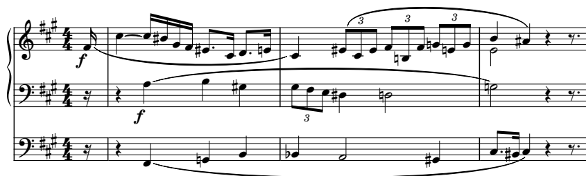
Przykład 1. Allegro con fuoco , t. 1–3

Prawdziwość powyższych stwierdzeń można zauważyć już od pierwszych taktów Sonaty . Melika głównego motywu pierwszego tematu Allegra (który jest zarazem głównym budulcem całej tej części) składa się bowiem niemalże ze wszystkich dźwięków skali dwunastodźwiękowej. Dopełnienie kompletnej skali znajduje się w głosach akompaniujących (zob. przykład 1.).