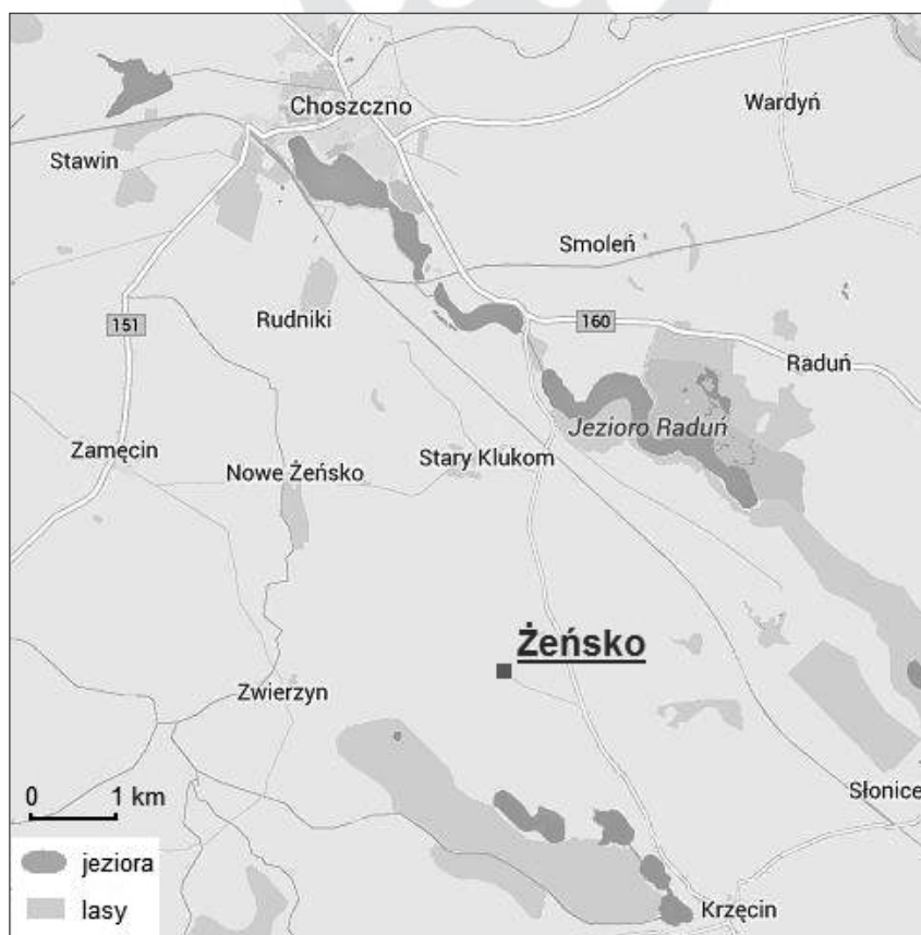
Ryc. 1. Położenie Żeńska

Żeńsko jest położone w województwie zachodniopomorskim, w powiecie Choszczno (ryc. 1). Zgodnie z podziałem fizycznogeograficznym Kondrackiego