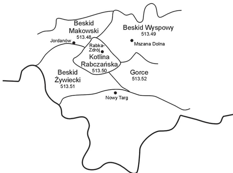
Ilustracja 1. Położenie Kotliny Rabczańskiej na tle sąsiednich mezoregionów (oprac. autor)