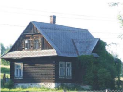
Chabówka, lata 20./30. XX w.