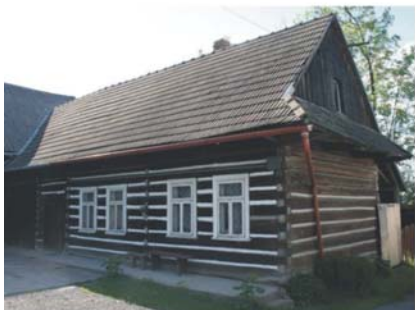
Skawa, przełom XIX i XX w.