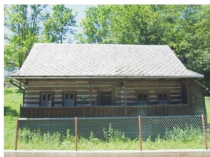
Rdzawka, początek XX w.