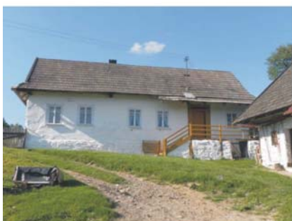
Rokiciny Podhalańskie, 1904 r.