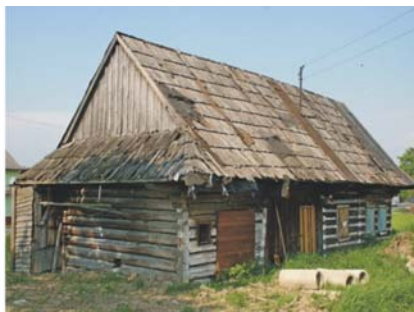
Spytkowice, przełom XIX i XX w.