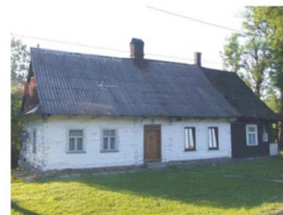
Rabka, ok. 1906 r.