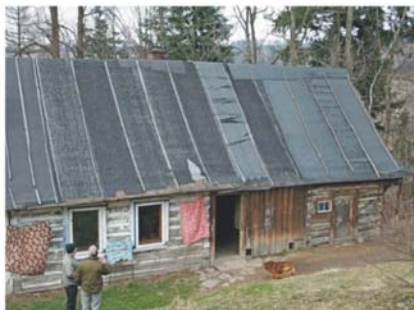
Raba Wyżna, przełom XIX i XX w.