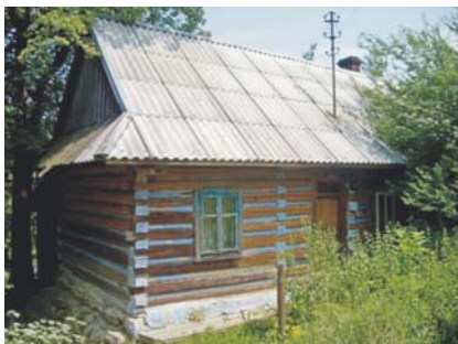
Sieniawa, druga połowa XIX w.