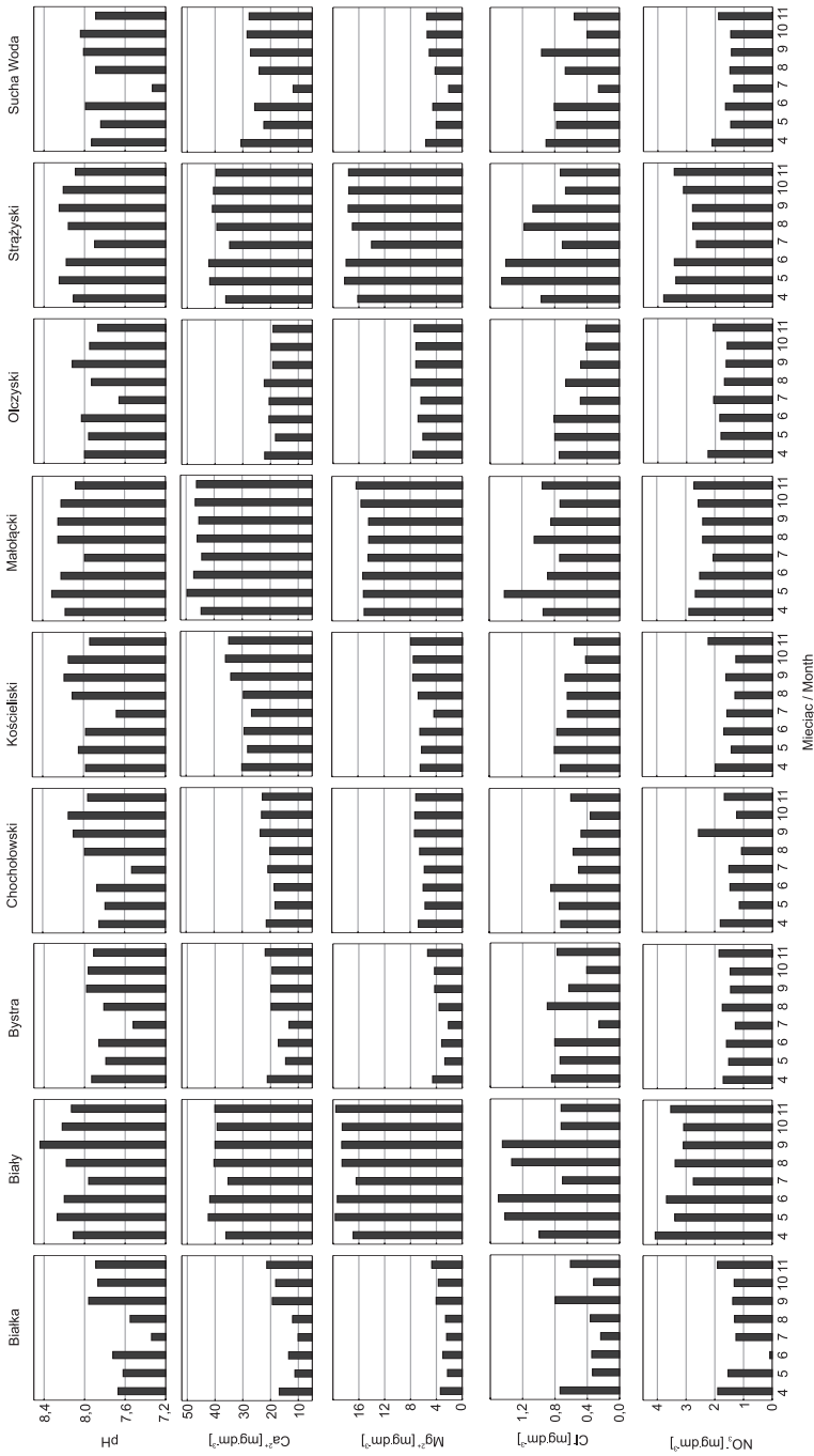
Ryc. 3. Sezonowe zmiany cech chemicznych wody potoków Fig. 3. Seasonal changes in the chemical properties of streamwater