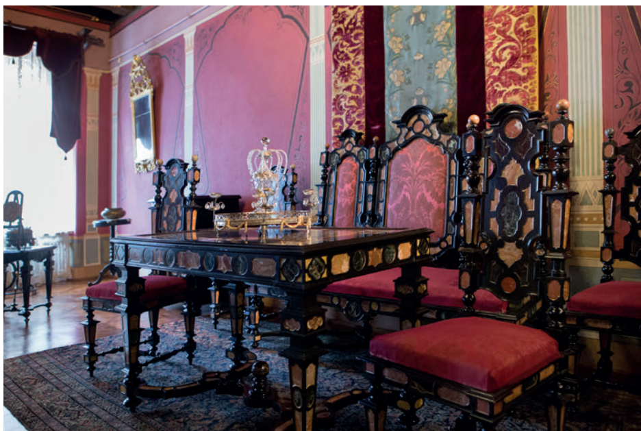
Il. 4. Współczesna ekspozycja muzealna.