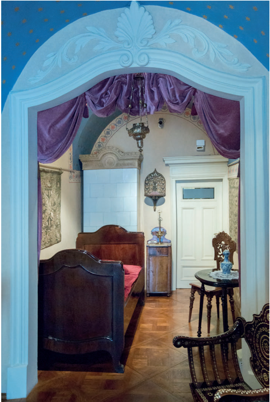
II. 5. Współczesna ekspozycja muzealna.