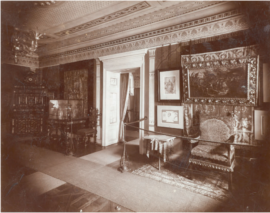
Il. 2. Salon w Domu Matejki (ujęcie na sypialnię) – ekspozycja muzealna z końca XIX w. została wykonana przez nieznanego autora (brak sygnatur i znaku zakładu) w celach dokumentacyjnych prawdopodobnie pod koniec XIX lub na przełomie XIX i XX w. współ.

Albin Dunajewski odprawił w kościele Mariackim nabożeństwo żałobne w niezwyklej oprawie muzycznej. Później kondukt żałobny okrążył Rynek Główny, a następnie ulicami Floriańską i Lubicz, przy dźwiękach dzwonu Zygmunta, udał się na cmentarz Rakowicki. Pogrzeb, na którym zgromadziły się tysiące Polaków ze wszystkich zaborów i z zagranicy, przerodził się w patriotyczną manifestację. W zbiorach Muzeum Narodowego w Krakowie, Oddział Dom Jana Matejki zachowały się telegramy z kondolencjami, wycinki prasowe, utwory poetyckie pisane ku czci artysty.