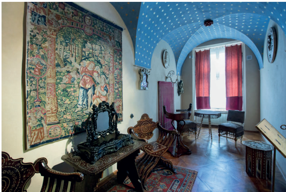
Il. 3. Współczesna ekspozycja muzealna.