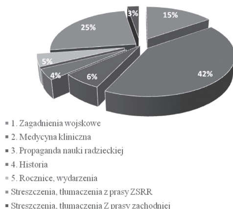
Ryc. 2. Zestawienie procentowe zawartości roczników z lat 1949–1953