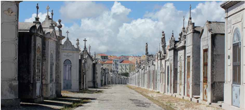
Ilustracja 3. Struktury pamięci , fotografia cyfrowa, Lizbona, 2022

W czasie intensywnej płynności – a coraz częściej: gwałtownych porywów i przepływów – rozpoznana forma daje schronienie, otula swojskością. Przypomina o wspólnocie myśli i wrażliwości.