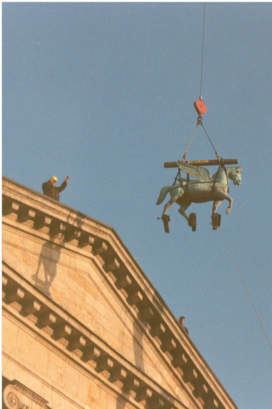
Ilustr. 6. Zdjęcie Pegaza w celu przeprowadzenia renowacji w 1997 r.