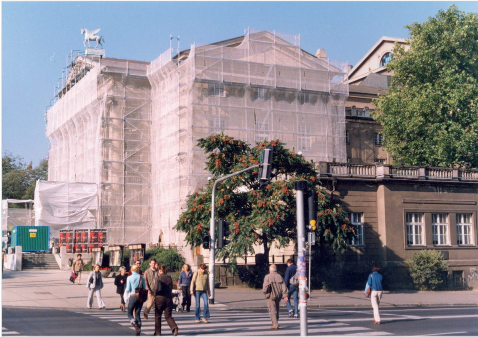
Ilustr. 8. Renowacja elewacji budynku w 2005 r.