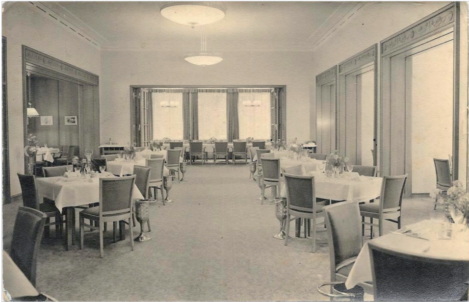
Ilustr. 4. Wnętrze restauracji teatralnej z lat 1941–1944 pocztówka ze zbiorów autora

można było zobaczyć reliefy znanych kompozytorów i pisarzy, które zaprojektował Karl Hartung 35 . Na czołowych ścianach zamontowano podzielone lustra ze złotym obramowaniem. Aby umożliwić dojście do foyer z bocznych schodów, przebito przejście w murze i zamontowano drzwi.