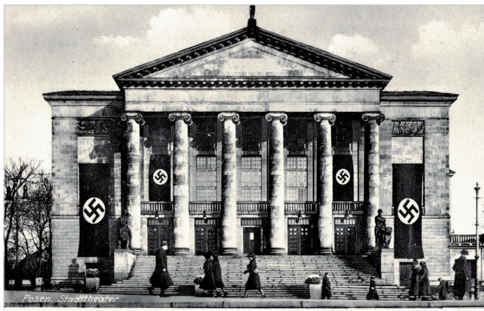
Ilustr. 5. Udekorowany Teatr z okazji urodzin Adolfa Hitlera 20 kwietnia 1940 r.

Dwukrotnie w ciągu roku Teatr, podobnie jak gmachy rządowe i użyteczności publicznej, był odświętnie dekorowany. Z okazji urodzin Hitlera 20 kwietnia oraz 8 października, aby upamiętnić włączenie Wielkopolski do Rzeszy i nadanie nazwy Warthegau. Poniższa fotografia pokazuje oflagowanie elewacji Teatru z okazji urodzin Hitlera w 1940 r.