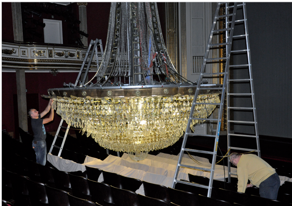
Ilustr. 7. Odnawianie żyrandola w 1997 r.