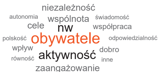
Rysunek 2. Chmura słów – rozumienie społeczeństwa obywatelskiego

Analiza semantyczna słów zawartych w odpowiedziach respondentów pozwoliła na stworzenie chmury najczęściej przyjmowanych określeń, definiujących pojęcie społeczeństwa obywatelskiego (rys. 2). Najczęściej użyte przez uczniów i uczennice słowa opisują społeczeństwo obywatelskie jako grupę „aktywnych obywateli, którzy tworzą zaangażowaną, niezależną wspólnotę ukierunkowaną na cel”. Stosunkowo duża część uczniów i uczennic nie potrafiła jednak zdefiniować tego pojęcia w ogóle (udzielając odpowiedzi „nie wiem”). W definicjach pozostałych osób występują także kategorie związane z wartościami takimi jak: odpowiedzialność, dobro, równość, autonomia, świadomość. Część badanych ogranicza to pojęcie do kategorii przynależności narodowej. W ich rozumieniu społeczeństwo obywatelskie to wąska grupa, ograniczona do polskich obywateli.