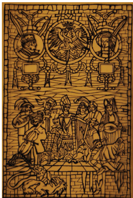
II. 7A. Projekt gobelinu Kapela na Wawelu , autor projektu Kazimierz Ostrowski, 1979