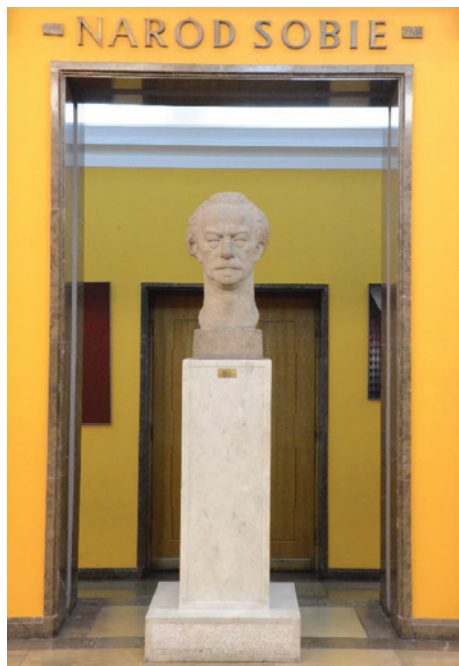
Il. 4. Ignacy Jan Paderewski , rzeźba Alfonsa Karnego, lata 50. XX wieku