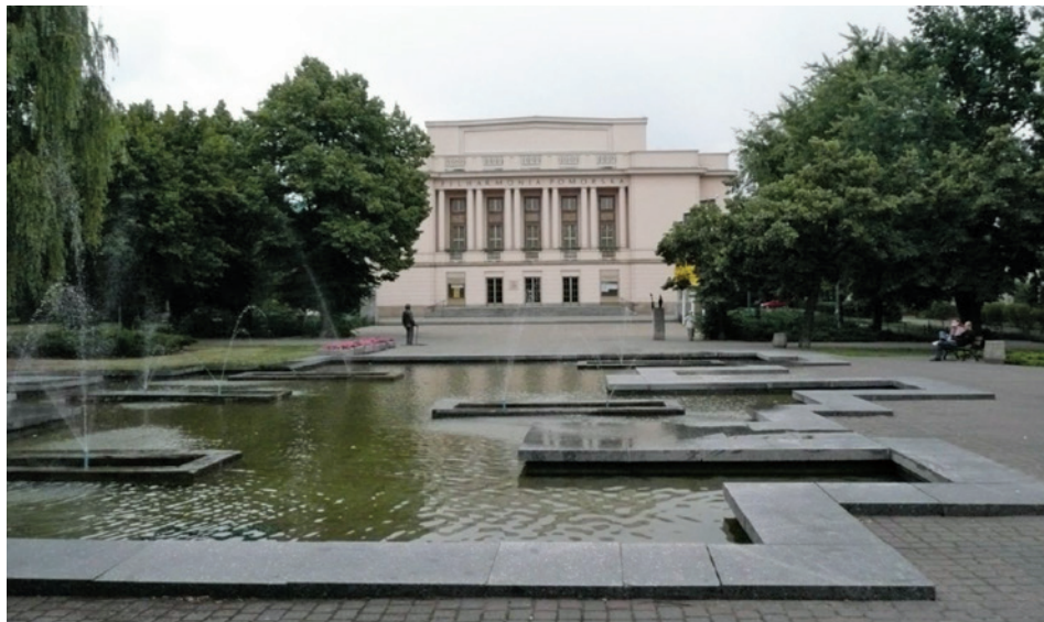
Il. 1. Filharmonia Pomorska im. I.J. Paderewskiego w Bydgoszczy, widok na elewację frontową, zachodnią