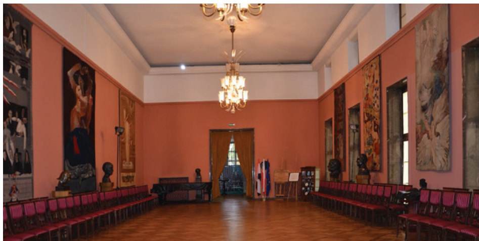
Il. 6. Wnętrze Filharmonii Pomorskiej w Bydgoszczy, ekspozycja gobelinów i rzeźb