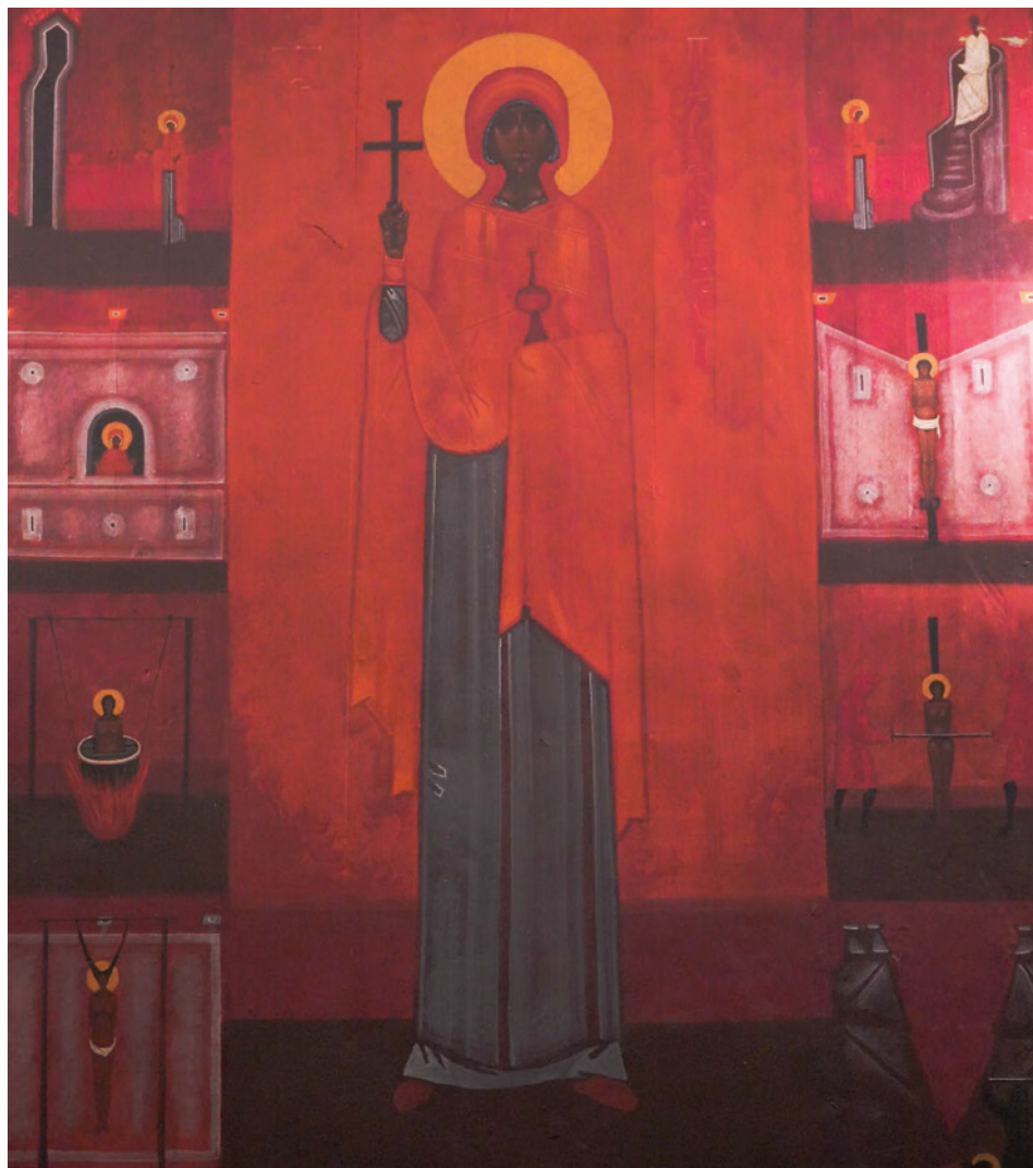
Il. 10. Obraz Św. Paraskewa, autor Jerzy Nowosielski, 1982