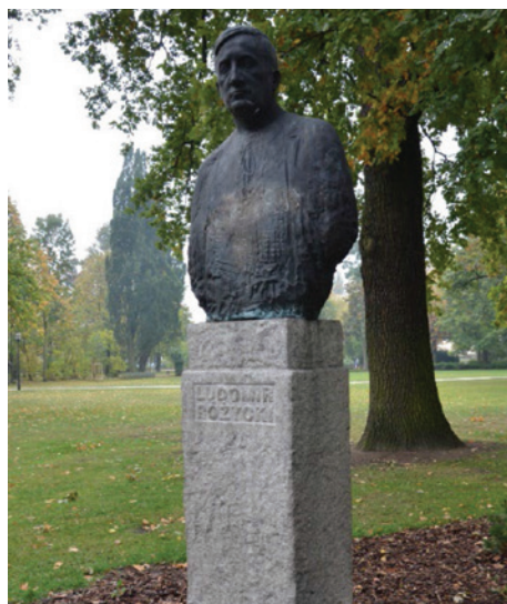
Il. 3. Ludomir Różycki , rzeźba Mieczysława Weltera, 1984

Równolegle zamawiano u rzeźbiarzy wizerunki polskich kompozytorów, składając we wnętrzach Filharmonii Pomorskiej w oryginalny sposób hołd dla ich dorobku i talentu. Największa liczba zamówień przypadła na koniec lat 70. i na początek