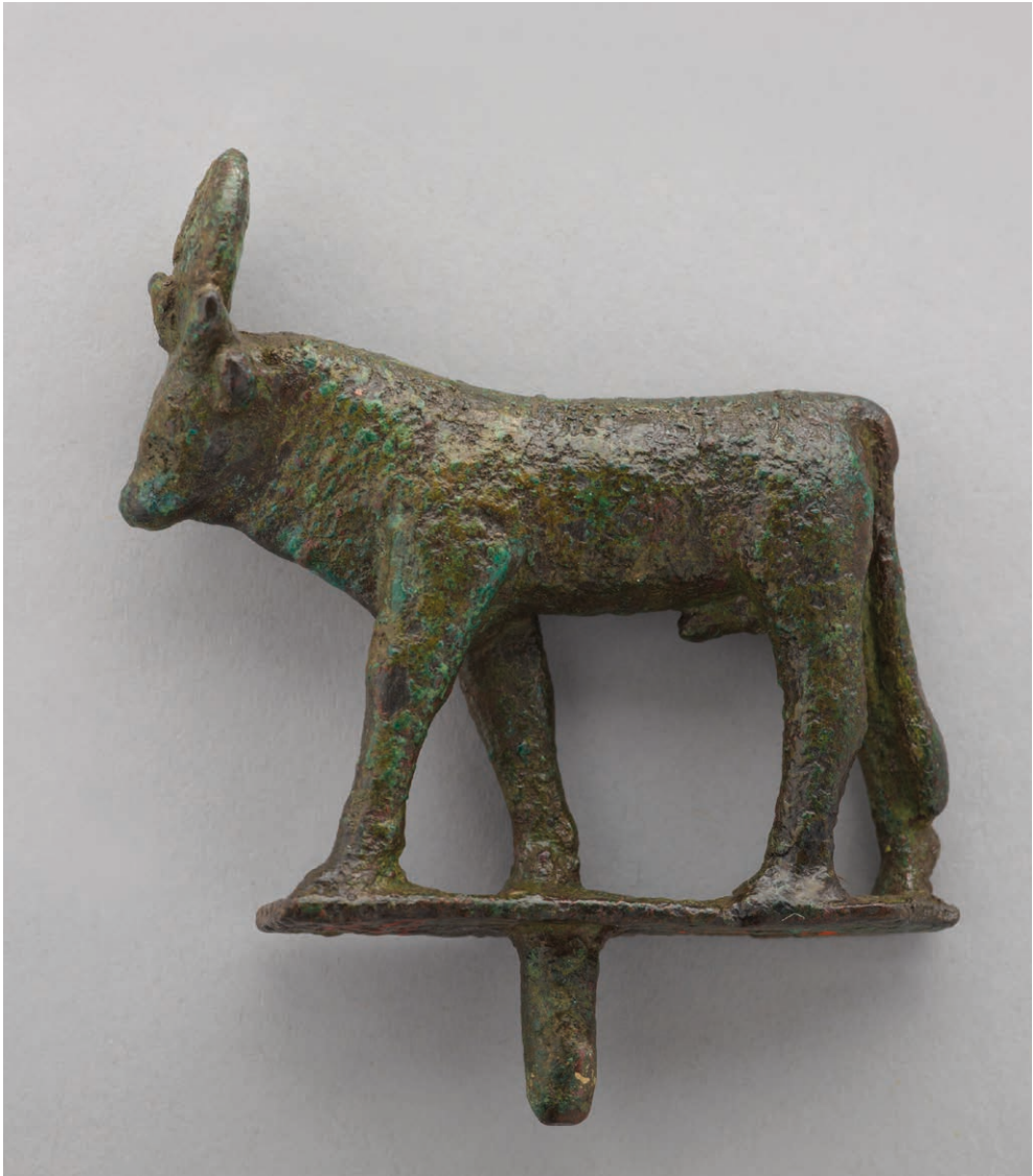
II. 4. Figurka Apisa, Egipt, Okres Późny, Muzeum Narodowe w Krakowie.

należy sklasyfikować jako falsyfikaty lub rodzaj pamiątek wzorowanych na obiektach starożytnych wykonanych pod koniec XIX wieku, część z pewnością w Italii. Są to: terakotowa główka kobieca 32 według modelu hellenistycznego, wykonane z brązu figurki Ozyrysa 33 , młodzieńców 34 i Heraklesa 35 wzorowane na przedstawieniach rzymskich, lampka oliwna