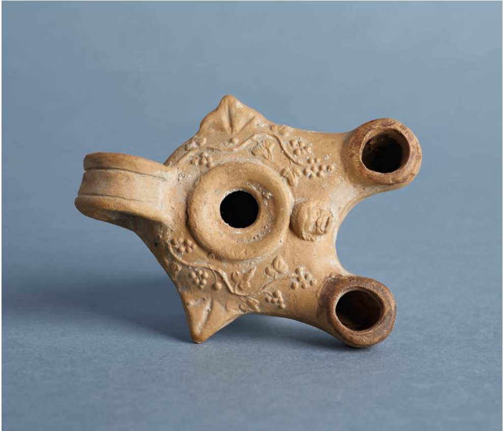
Il. 2. Lampka oliwna, Italia, 3/4 ćwierć XIX wieku, Muzeum Narodowe w Krakowie.

Również w 1884 roku Karol Odrowąż Pieniążek (1850–1901) 5 , adwokat i przyszły wiceprezydent Krakowa, urzędujący od 1893 roku w czasie prezydentury Józefa Friedleina 6 , przekazał do zbiorów lampkę oliwną 7 (il. 2).