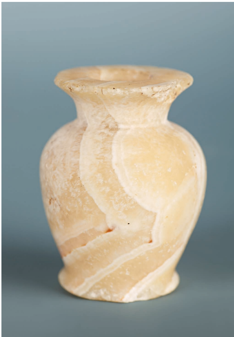
II. 5. Naczynko kosmetyczne, Egipt, Średnie Państwo, Muzeum Narodowe w Krakowie.