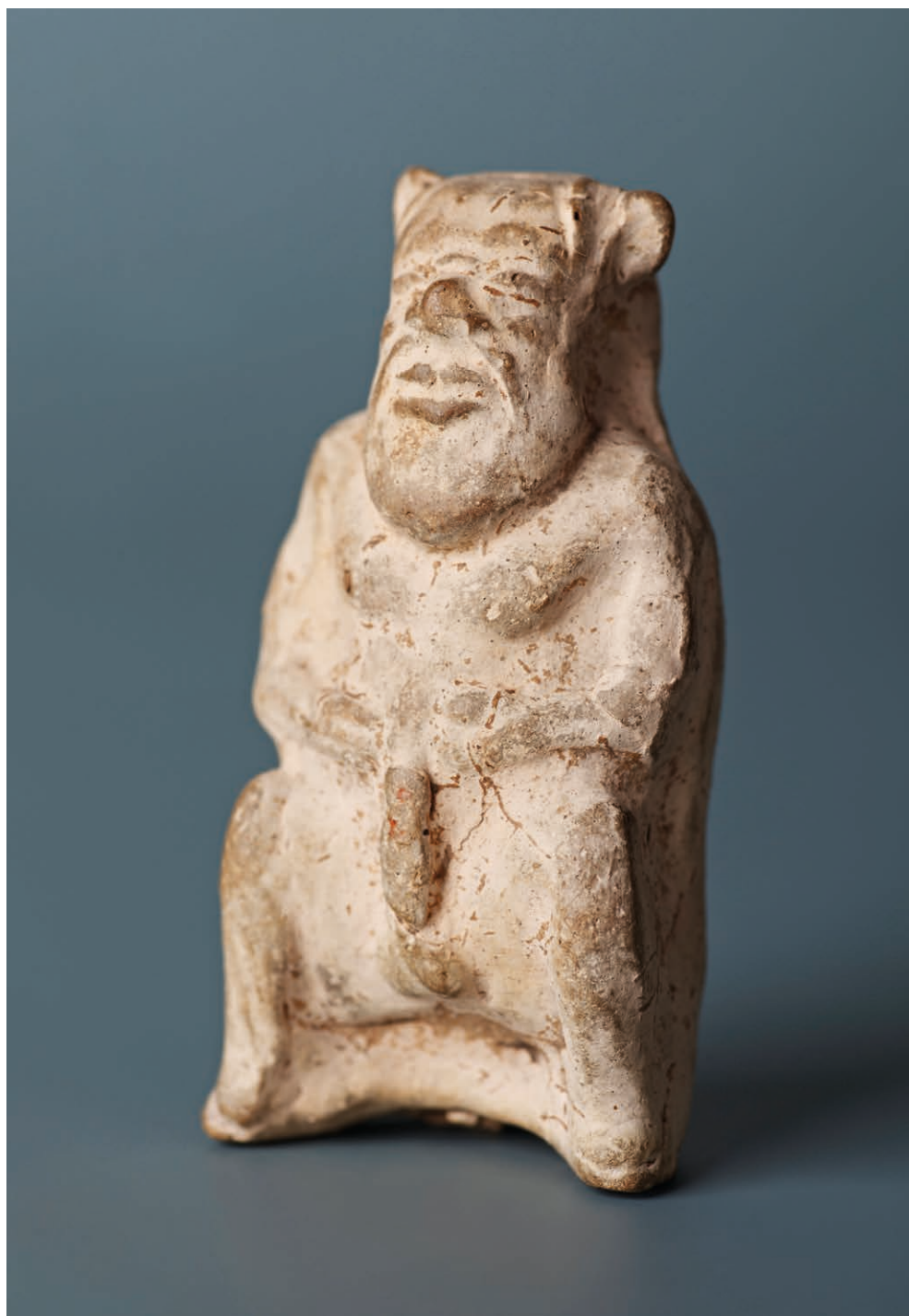
II. 3. Figurka Sylena, Grecja, 1 połowa V wieku p.n.e., Muzeum Narodowe w Krakowie.