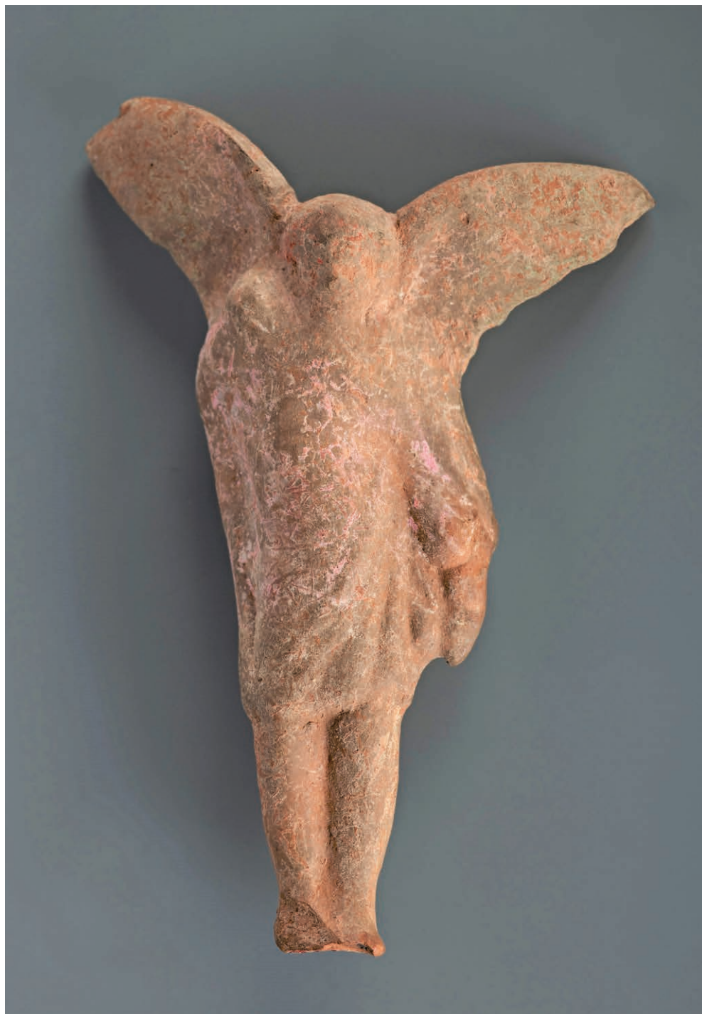
II. 6. Figurka erosa grobowego, Grecja, 2 połowa II–I wieku p.n.e., Muzeum Narodowe w Krakowie.