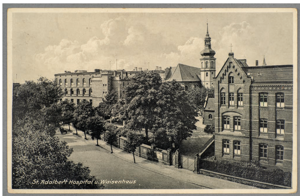
Il. 4. St. Adalbert Hospital u. Waisenhaus – Szpital i sierociniec św. Wojciecha. Dar Uniwersyteckiego Stowarzyszenia na rzecz Ratowania Zabytków Śląska Opolskiego. Wydawnictwo Graph. Kunstanstalt Kettling & Krüger, Schalksmühle i. Westf. Nr 31174, pocz. XX w.