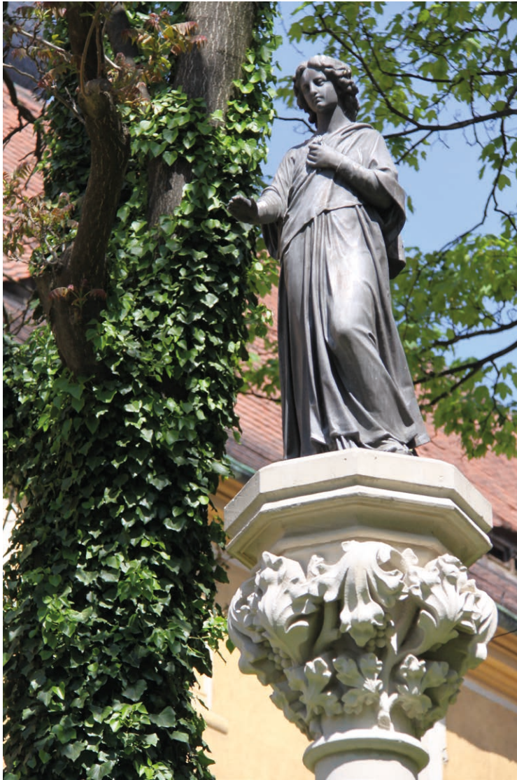
II. 5. Muza łagodności autorstwa Hermana Wittiga.

urbanistycznego, demograficznego i kulturalnego miasta, które ostatecznie uzyskało status ośrodka uniwersyteckiego. Można dziś powiedzieć za prof. Stanisławem Nicieją: