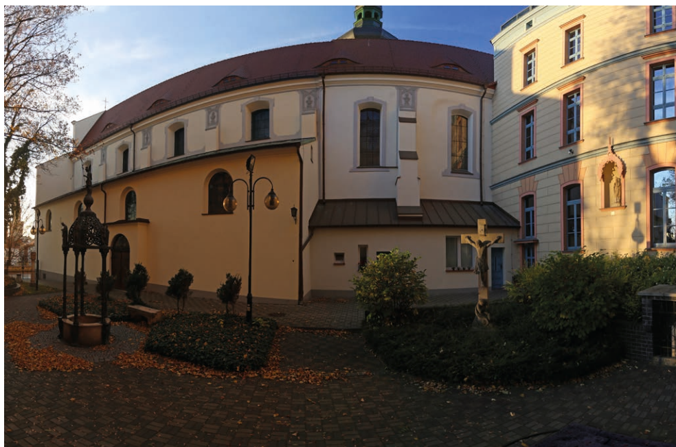
II. 6. Studnia św. Wojciecha w dawnym wirydarzu klasztornym. Ze zbiorów MUO, fot. J. Stemplewski

Piękno i zachwyt nad dzisiejszym Wzgórzem Uniwersyteckim przekonują, że miał rację. Wzgórze Uniwersyteckie stało się jednym z najchętniej odwiedzanych przez opolan i turystów miejsc w naszym mieście.