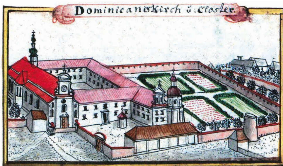
Il. 2. Klasztor Dominikański wraz z kościołem Najświętszej Marii Panny ok. poł. XVIII w., rys. F.B. Wernera.

Najstarsze zatem relikty architektoniczne Wzgórza Uniwersyteckiego to gotyckie fragmenty murów, prezbiterium kościoła poddominikańskiego NMP i pozostałość wieży zamku Górnego z fosą obronną. Dominikanie początkowo otrzymali prowizoryczne zabudowania na opolskim wzgórzu wraz z funkcjonującym tu kościołem NMP. Niestety nie zachował się dokument fundacyjny opolskiego klasztoru 21 . Rok 1295 to data potwierdzenia obecności dominikanów na wzgórzu 22 . Drewniane budynki klasztorne zostały wzniesione na skale wapiennej na płytkich fundamentach, w najstarszych częściach wykonanych z kamienia. W latach 1361–1364 klasztor i przylegający do niego poświęcony kościół pod wezwaniem św. Wojciecha były już budowlami murowanymi. Pierwszy znany rysunek klasztoru Dominikanów autorstwa śląskiego kartografa i rysownika Fryderyka Bernarda Wernera pochodzi z połowy XVIII wieku (zob. il. 2).