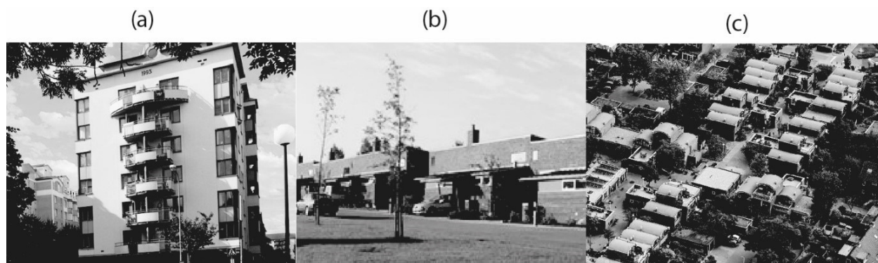
Tabela 1. Przykłady zamkniętych przestrzeni rekreacyjnych cohousingu. Źródło: opracowanie własne na podstawie stron internetowych badanych podmiotów

Ill. 1. Type of cohousing development: (a) Färdknäppen, (b) Egebakken, (c) Centraal Wonen Wandelmeent; Source: (a) http://fardknappen.se/om-oss/ (accessed: 5.09.2022) (b) http://www.egebakken.dk/husene/ (accessed: 5.09.2022) (c) https://wandelmeent.nl/beschrijving-project-2/ (accessed: 5.09.2022)