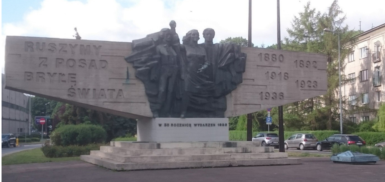
Il. 8. Sakralizacja miejsca – kontynuacja (pozostały: desygnat, znak i rytuał – obchodzi się tu m. in. Święto Pracy 1 Maja). Pomnik Czynu Zbrojnego Proletariatu Krakowa (Pomnik Semperitowców), wg projektu Antoniego Hajdeckiego, odsłonięty w marcu 1986 r. Kraków, aleja Ignacego Daszyńskiego. Istnieje do dzisiaj i jest miejscem rytuału środowisk lewicowych. Fot. L. Bylina, maj 2022

III. 8. SACRALISATION of a place – continued (remain in place: designatum , sign , and ritual – such events as the Labour Day on 1 May are celebrated here). Monument to the Militant Proletariat in Krakow (Semperit Labourer Monument) was designed by Antoni Hajdecki and unveiled in March 1986. Kraków Ignacego Daszyńskiego Avenue. It exists today and leftist rituals take place there. Photograph L. Bylina, May 2022