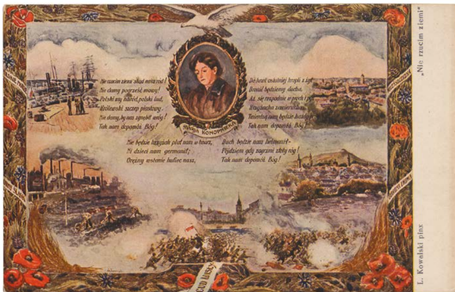
Il. 12. Karta pocztowa Nie rzucim ziemi , Bibl. Nauk. PAU i PAN, rkps 4887, k. 69