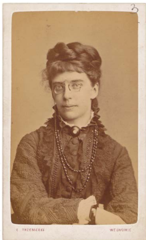
Il. 5. Fotografia Marii Konopnickiej autorstwa E. Trzemeskiego we Lwowie, Bibl. Nauk. PAU i PAN, rkps 7658, k. 3