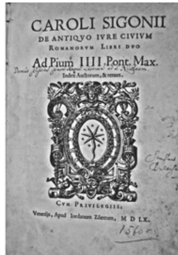
1. Karta tytułowa dzieła K. Sigoniusa De antiquo iure civium... (Venetijs 1560).

Pod tytułem nota proveniencyjna: Domus Calissien[sis] Canon[icorum] Reg[ularium] Lateran[ensium] ad S[anctum] Nicolaum ). Egz. ze zbiorów Miejskiej Biblioteki Publicznej im. A. Asnyka w Kaliszu