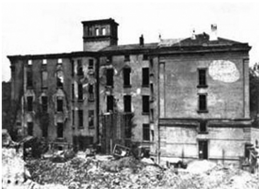
Ryc. 3. Budynek Oddziału Farmaceutycznego Wydziału Lekarskiego Uniwersytetu i Politechniki Wrocławskiej w roku powołania uczelni (1945)