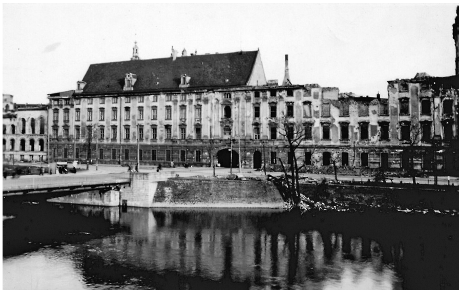
Ryc. 2. Gmach Główny Uniwersytetu i Politechniki Wrocławskiej w roku powołania uczelni (1945)