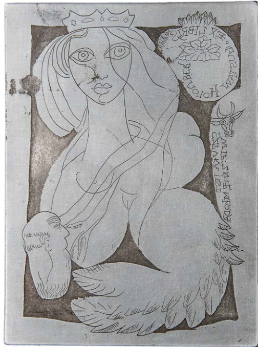
Il. 2. Matryca ekslibrisu Gustawa Holoubka (sygn. m. 138)