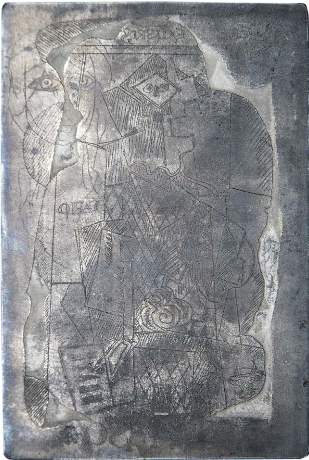
Il. 7. Matryca ekslibrisu Pabla Picassa (sygn. m. 262)