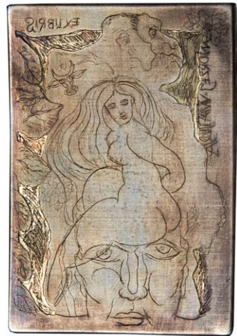
Il. 8. Matryca ekslibrisu Andrzeja Wajdy (sygn. m. 344)