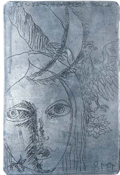
Il. 5. Matryca ekslibrisu Ignacego Paderewskiego (sygn. m. 247)