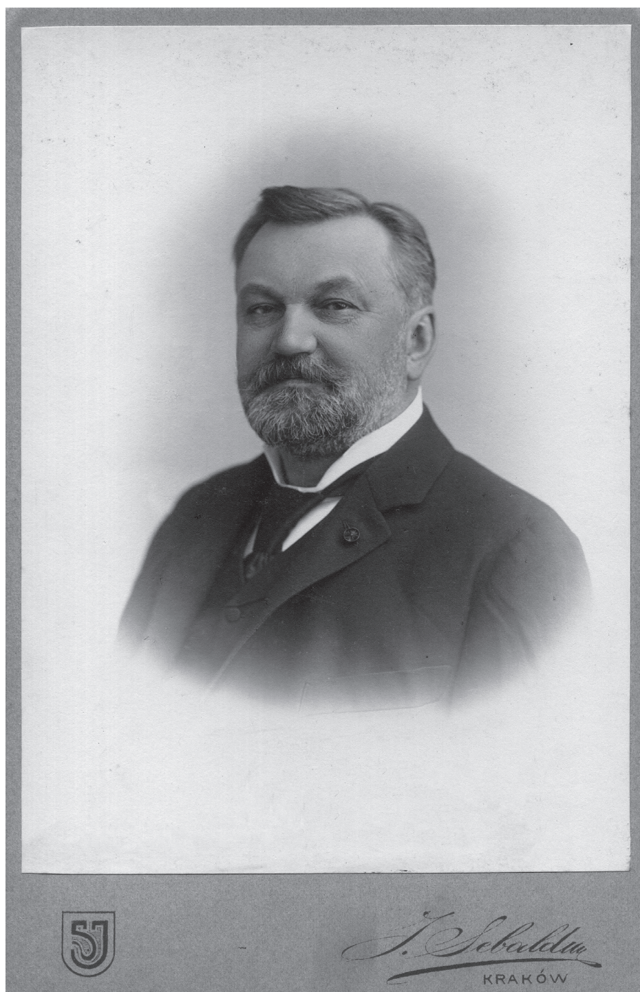
Fot. 1. Erazm Jerzmanowski, koniec lat. 90. XIX wieku.