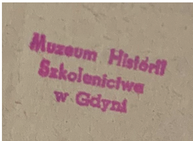
Fot. 3. Odcisk pieczęci Muzeum Historii Szkolenictwa w Gdyni z błędem ortograficznym na jednym z dokumentów przechowywanych w Pedagogicznej Bibliotece Wojewódzkiej w Gdańsku

Natomiast w gdyńskim oddziale ZNP pozostał dość zróżnicowany zbiór materiałów głównie dotyczących martyrologii gdyńskich nauczycieli oraz historii sekcji emerytów i rencistów ZNP. Ponadto znajdują się tam pisma branżowe tj. „Związkowy Biuletyn Prawno-Organizacyjny” czy prace magisterskie dotyczące dziejów Związku 19 .