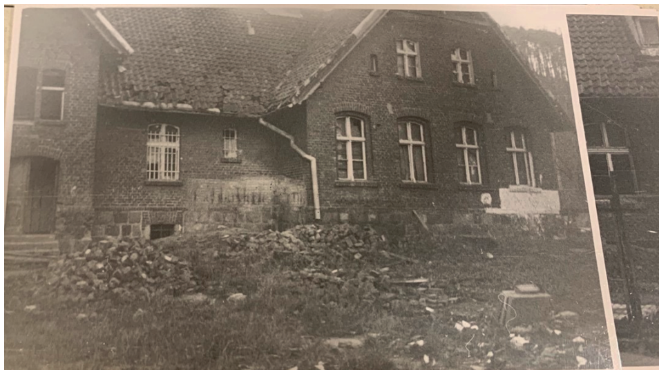
Fot. 1. Gmach przy ul. Lubawskiej 4 w Gdyni Chyloni

Siedzibą muzeum miał stać się dawny, pochodzący z XIX w. budynek szkolny zlokalizowany w Gdyni Chyloni przy ul. Lubawskiej 4, stojący tam do dziś. Aby jednak muzeum mogło rozpocząć tam swoją działalność, konieczne było przeprowadzenie kompleksowego remontu 14 . Ostatecznie jednak po nieudanym zabieganiu o remont bądź pozyskanie innego budynku, a także dodatkowe etaty dla placówki, na początku lat dziewięćdziesiątych muzeum uległo likwidacji. Zbiory zebrane w trakcie przygotowywania do jego otwarcia zostały przekazane wówczas do Pedagogicznej Biblioteki Wojewódzkiej w Gdańsku, Muzeum Miasta Gdyni, a część z nich pozostała w gdyńskim oddziale ZNP. Materiały te przechowywane są w tych instytucjach do dziś.