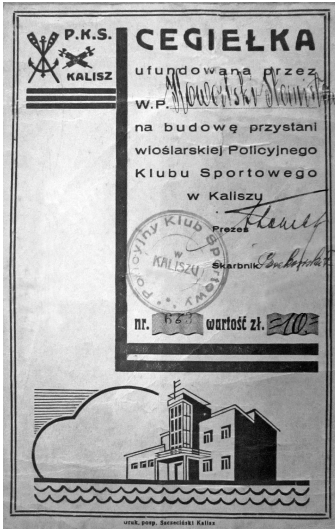
Fot. 2 Cegiełka na budowę przystani wioślarskiej PKS w Kaliszu

Władze Klubu wydzierżawiły na 15 lat plac (650 m 2 ) nad brzegiem Proсны przy Wale Piastowskim. Prace budowlane wykonywali członkowie PKS. Postawiony hangar, szatnie oraz pomost, mimo że prowizoryczny, umożliwił korzystanie z taboru. W 1934 r. po akceptacji planów budowlanych przez Urząd Wojewódzki w Łodzi (Nr. K. B. III-5-C/5-1) oraz uzyskaniu pozwolenia od Starosty Powiatowego w Kaliszu przystąpiono do budowy stałej przystani 59 . Prace budowlane trwały do maja 1937 r. Inwestycja realizowana była ze środków finansowych pochodzących z składek policjantów oraz sprzedaży „cegielek”. Przystań wioślarską PKS w Kaliszu oddano do użytku 1 maja 1937 r. 60