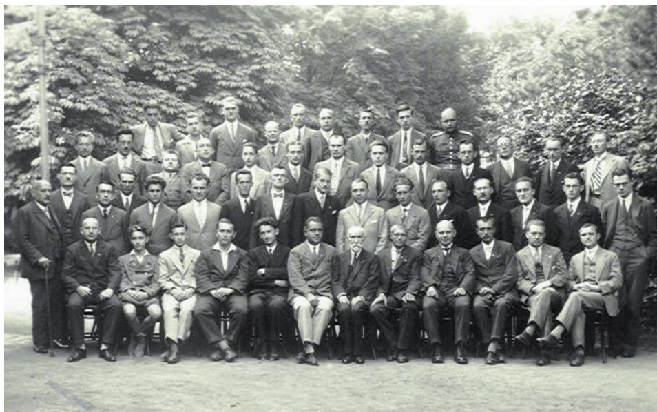
Fot. 3. Uczestnicy turnieju głównego podczas zjazdu ÚJČŠ w Brnie w 1929 r.