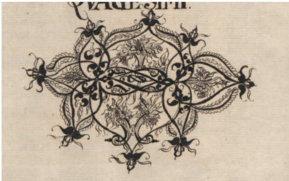
Il. 5. Floratura z księgi przyjęć do prawa miejskiego w Lublinie (rysunek autorstwa Stanisława Kukro), 1650 r.