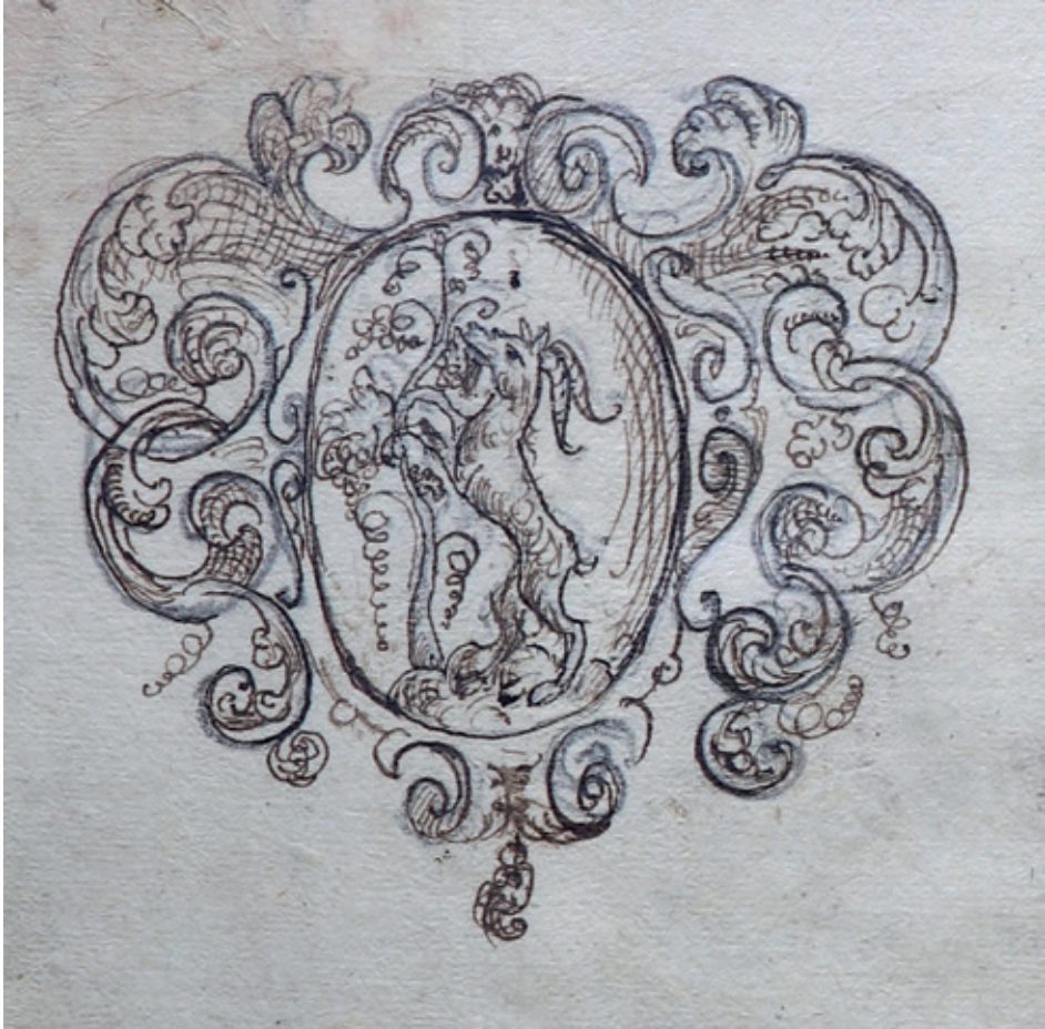
Il. 1. Herb miasta Lublina w księdze rady miejskiej z 1654 r. (rysunek autorstwa Stanisława Kukro)