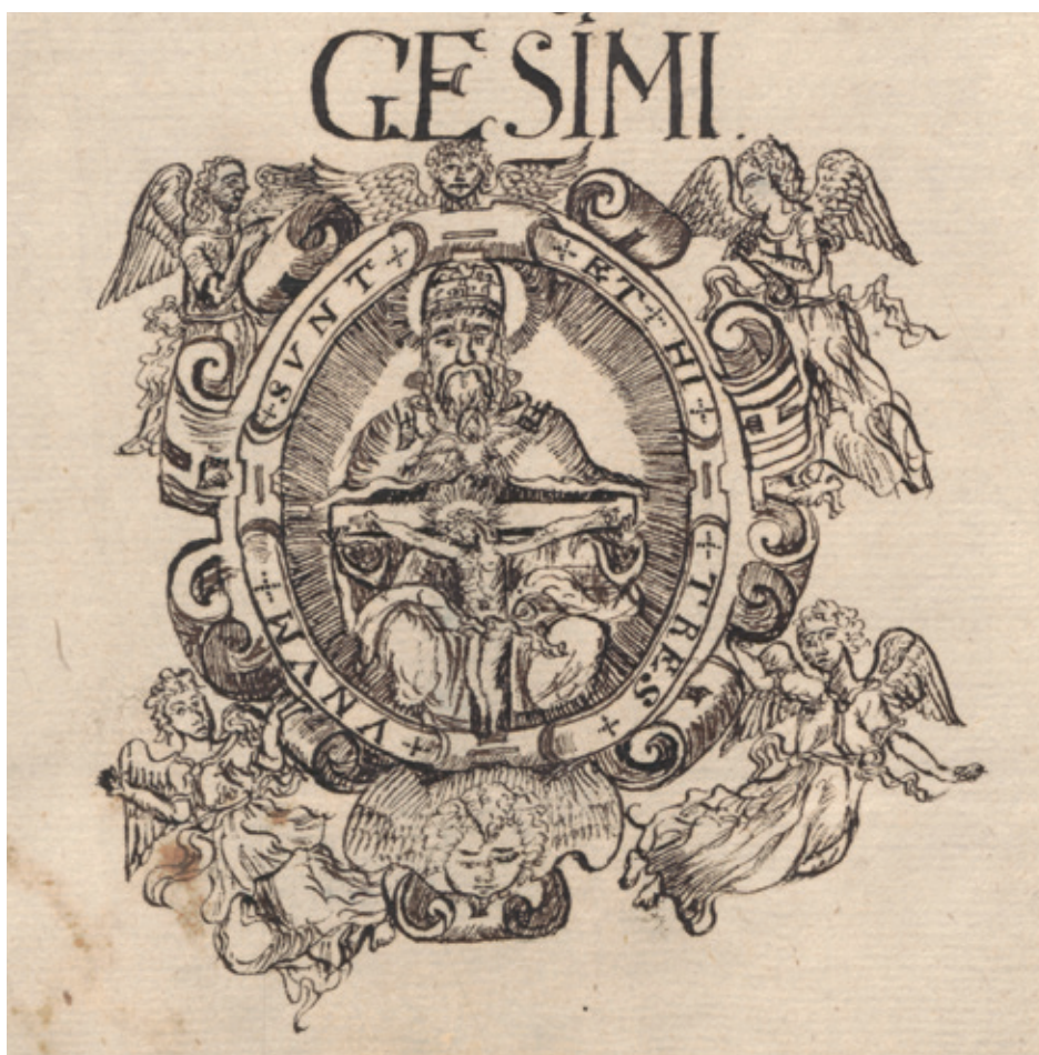
Il. 4. Mandrola z wyobrażeniem Trójcy Świętej zdobiąca stronę tytułową księgi przyjęć do prawa miejskiego w Lublinie w 1650 r. (rysunek autorstwa Stanisława Kukro)