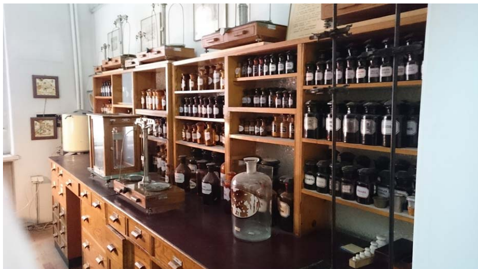
Ryc. 11. Receptura na początku 2019 r..