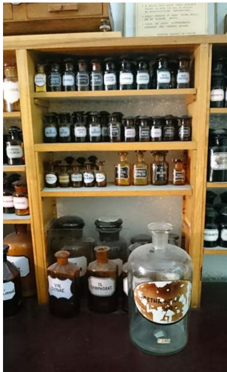
Ryc. 16. Przykład błędnego umieszczenia naczyń recepturowych przeznaczonych na trucizny

używane wyłącznie w bydgoskiej aptece „Pod Łabędziem”, jednak pierwotnie znajdowały się w obszernym pomieszczeniu od frontu budynku. W obecną miejscę przeniesiono je w 1990 r., po reprivatyzacji przedsiębiorstwa. Relokacji towarzyszyło znaczne ograniczenie liczby mebli i sprzętów, co było spowodowane zmniejszeniem ilości wykonywanych leków recepturowych na rzecz gotowych specyfików wytwarzanych przez przemysł farmaceutyczny. Wyposażenie izby recepturowej nie jest kompletne i nie stanowi logicznej całości. Wchodzące w jego skład naczynia są niejednorodne pod względem czasu powstania oraz przeznaczenia. Sposób ich ustawienia nie odpowiada standardom pracy w recepturze. Panujący chaos sprawia, że zachowane obiekty nie mogą być odczytywane jako świadectwo mówiące o rodzaju wykonywanych leków. Izba recepturowa stanowi więc oryginalne wyposażenie apteki „Pod Łabędziem” z okresu PRL-u, zachowane jednak w okrojonej w 1990 r. formie, odpowiadającej zapotrzebowaniu typowemu dla wolnego rynku farmaceutycznego. Jej usytuowanie jest, jak wspomniano, wtórne. Wśród zachowanych naczyń panuje nieporządek. Nad genius loci przeważa więc wyraźnie suma przypadków. Z tego powodu przygotowywana ekspozycja będzie musiała polegać w znacznym stopniu na odtworzeniu standardów panujących w recepturze z okresu Polski Ludowej (Ryc. 15).