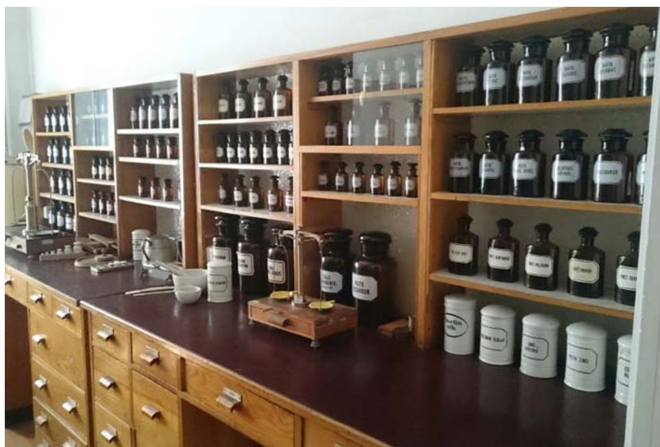
Ryc. 15. Propozycja aranżacji – odtworzenie standardu receptury z okresu PRL-u