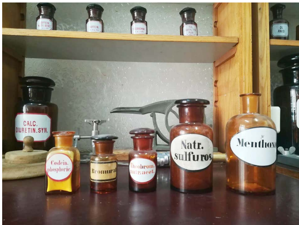
Ryc. 14. Przykładowe sztanglasy apteczne o różnych kształtach