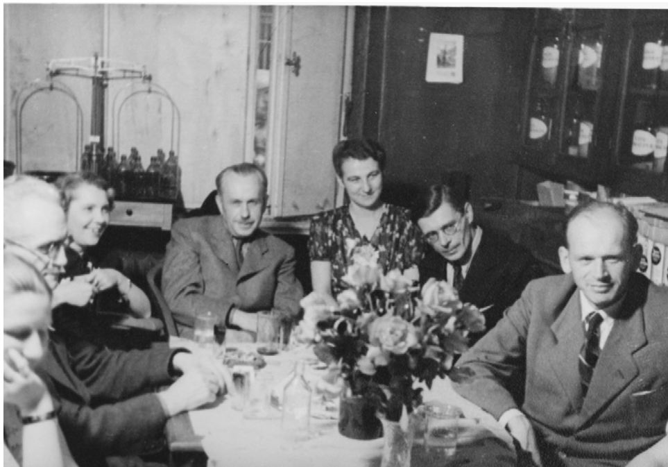
Ryc. 3. Pomieszczenie, w którym obecnie znajduje się receptura, lata pięćdziesiąte XX w. (własność Muzeum Okręgowego im. Leona Wyczółkowskiego w Bydgoszczy, nr inw. MOB FM/AF-002882 1, repr. W. Woźniak)