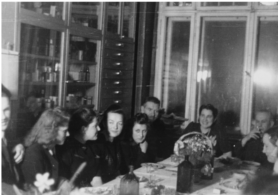
Ryc. 4. Pomieszczenie, w którym obecnie znajduje się receptura, lata pięćdziesiąte XX w. (własność Muzeum Okręgowego im. Leona Wyczółkowskiego w Bydgoszczy, nr inw. MOB FM/AF-002882 10,)