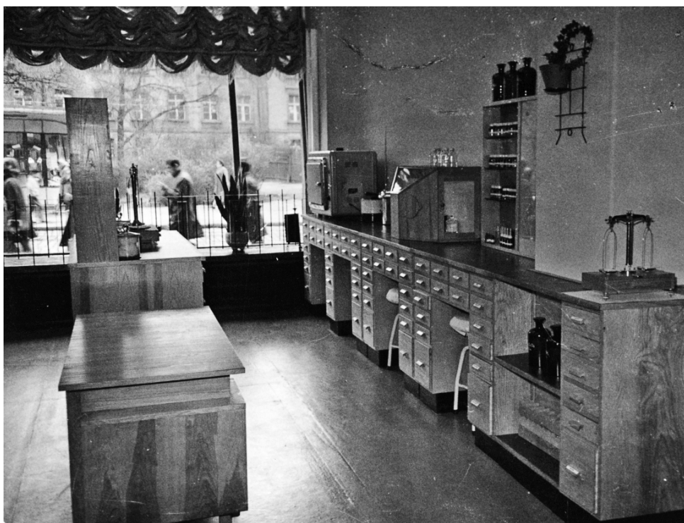
Fot. 8. Nowe wyposażenie receptury z początku lat siedemdziesiątych XX w. (prywatne archiwum mgr farm. Łucji Wachowskiej, repr. W. Woźniak)