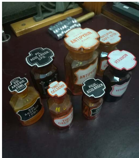
Ryc. 13. Przykładowe sztanglasy apteczne o nietypowym kształcie – z powtórzeniem tytułika na korku, przez co unikano omyłkowej zamiany korka i zanieczyszczenia substancji

Przeprowadzona analiza pozwoliła stwierdzić, że badane łoże recepturowe zostały wyprodukowane najprawdopodobniej w Zasadniczej Szkole Drzewnej w Nowem nad Wisłą na przełomie lat sześćdziesiątych i siedemdziesiątych XX w. Wtedy bowiem zainstalowano je jako nowe wyposażenie wyremontowanej apteki. Wpisywały się w ówczesny standard wyposażenia izb recepturowych w aptekach społecznych w Polsce. Łoże były