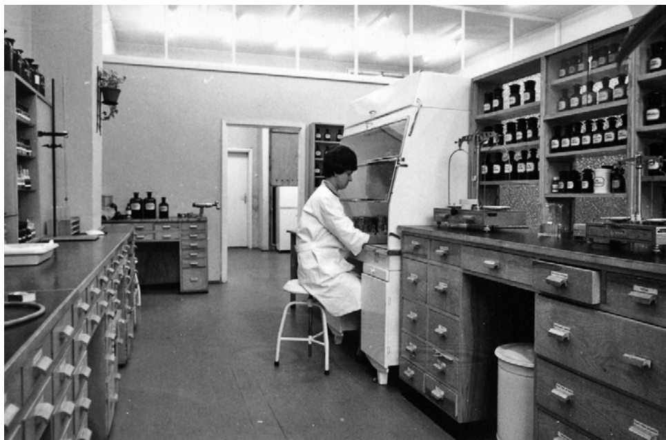
Fot. 7. Nowe wyposażenie receptury z początku lat siedemdziesiątych XX w.