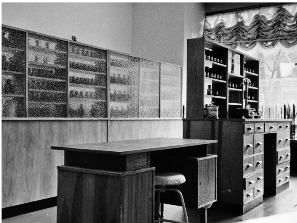
Fot. 6. Nowe wyposażenie receptury z początku lat siedemdziesiątych XX w.