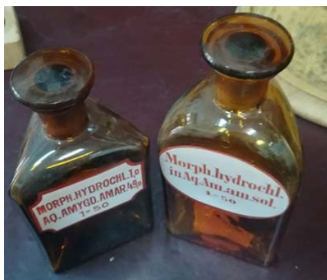
Ryc. 12. Przykładowe sztanglasy apteczne o nietypowym – trójkątnym – kształcie

Kilka butelek wykonanych zostało ze szkła bezbarwnego, co może sugerować ich pochodzenie z końca XIX w. Interesującym elementem różniącym butelki są kształty podstaw. Obok większości – czworokątnych, wyróżnić można również okrągłe czy trójkątne. Może wskazywać to na ich odmienne pochodzenie. Kierujący apteką zamawiał bowiem najczęściej w jednej, wybranej firmie cały zestaw naczyń, jednakowych pod względem stylistycznym. Różnorodny kształt naczyń może też jednak świadczyć o ich specyficznym przeznaczeniu, np. do przechowywania trucizn (Ryc. 12–14).