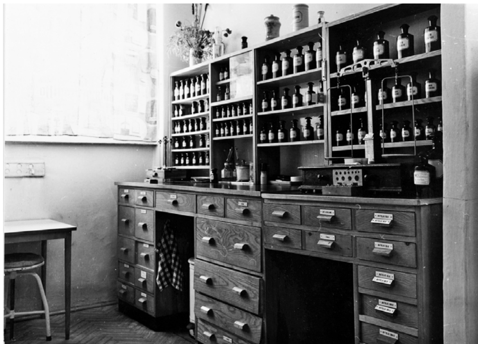
Ryc. 9. Meble recepturowe z apteki w Lubrańcu (własność Muzeum Okręgowego im. Leona Wyczółkowskiego w Bydgoszczy, nr inw. MOB FM/AF-2737, repr. W. Woźniak)

– w szczególności dla zagwarantowania właściwej jakości – najnowsze urządzenia, jak autoklaw do sterylizacji sprzętu i opakowań, łoża z laminarnym nawiewem, zapewniająca warunki aseptyczne, a także waga elektryczna i inne 24 .