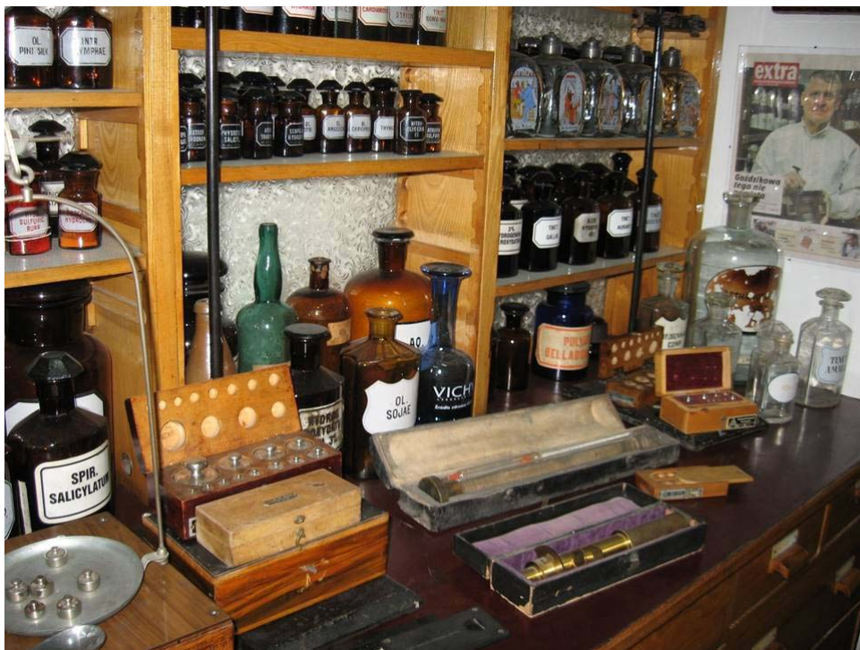
Ryc. 10. Receptura pełniąca funkcje magazynowe, ok. 2005 r.

Zrezygnowano więc m.in. z łoży szkoleniowej, stołu kontrolnego, destylatora, suszarki, promiennika podczerwieni do topienia podłoża maściowych, mieszadła elektromagnetycznego i czopkarki. Redukcja wyposażenia receptury wynikała z rosnącego udziału w obrocie aptecznym leków gotowych, wytwarzanych przez intensywnie rozwijający się globalny przemysł farmaceutyczny, wypierających leki recepturowe. W 2003 r., po powstaniu muzeum farmacji, izba recepturowa utraciła swoją pierwotną funkcję, stając się częścią stałej ekspozycji. Z czasem jednak zaczęła pełnić funkcję „magazynu” dla rosnącej liczby zabytków 27 . Prywatne muzeum nie dysponowało bowiem przestrzenią magazynową (Ryc. 10).