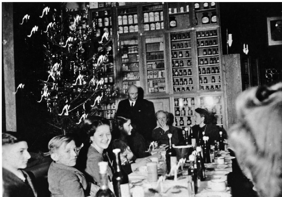
Ryc. 1. Wnętrze apteki w czasie II wojny światowej (własność Muzeum Okręgowego im. Leona Wyczółkowskiego w Bydgoszczy, nr inw. MOB MOB FM/AF-2526/6, repr. W. Woźniak)