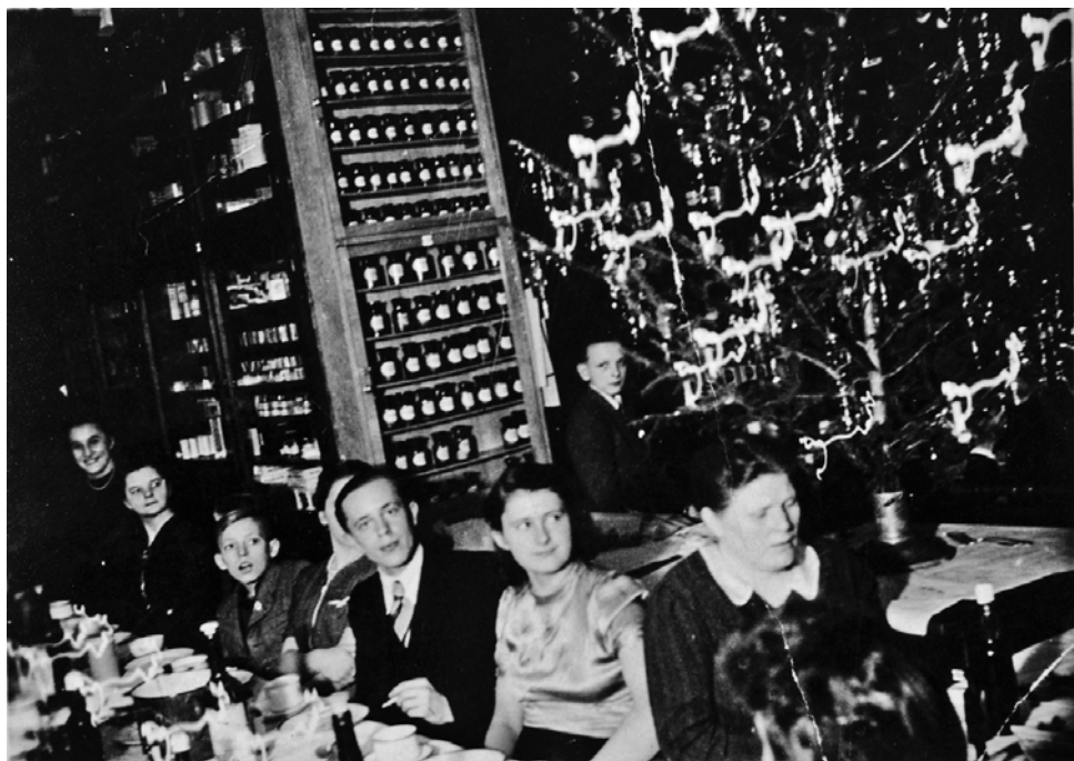
Ryc. 2. Wnętrze apteki w czasie II wojny światowej (własność Muzeum Okręgowego im. Leona Wyczółkowskiego w Bydgoszczy, nr inw. FM/AF-2526/4, repr. W. Woźniak)