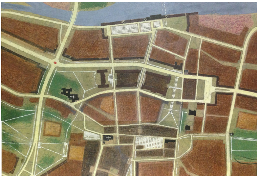
Il. 6. Plan ogólny zagospodarowania przestrzennego Rzeszowa Z. Wzorka. Pasma wschód–zachód zabudowy Śródmieścia (źródło: Archiwum BRMRz)