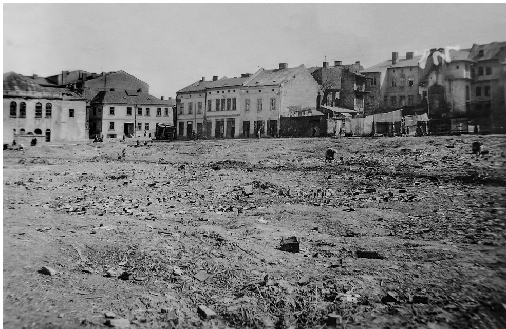
Il. 3. Teren zlikwidowanego przez Niemców starego cmentarza żydowskiego