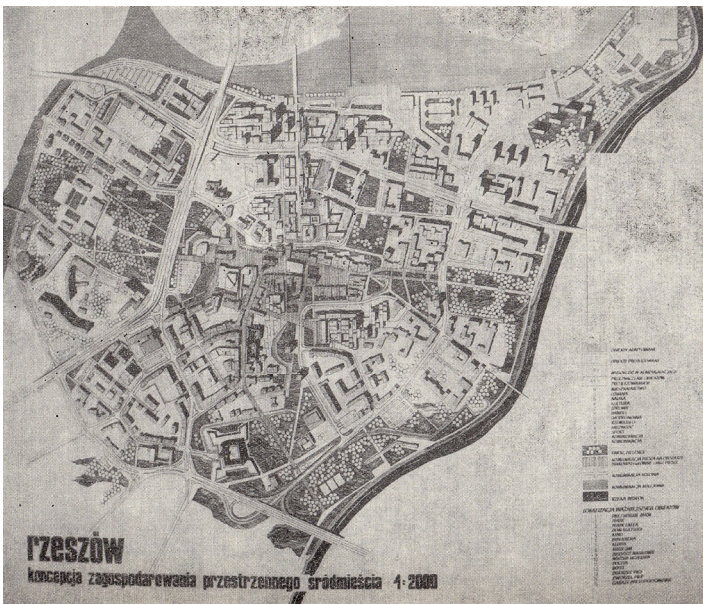
Il. 11. Koncepcja zagospodarowania przestrzennego Śródmieście Rzeszowa. Pierwsza nagroda w Konkursie nr 520 SARP Centrum Rzeszowa