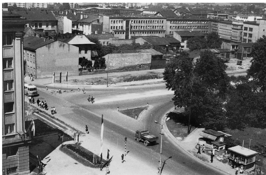
Il. 9. Rzeszów. Skrzyżowanie ul. Grunwaldzkiej i al. Lenina (współcześnie al. Piłsudskiego). Lata 60. XX w.