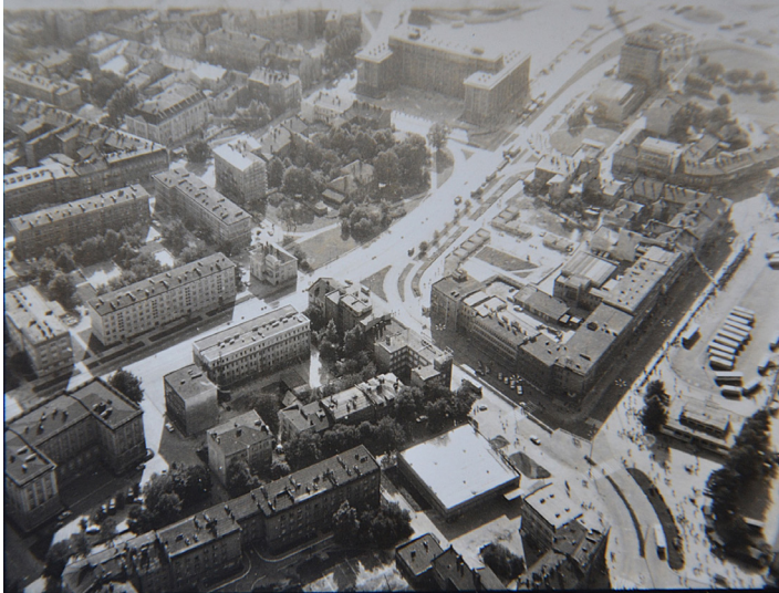
Il. 10. Śródmieście Rzeszowa, lata 60. XX w. Rejon al. Lenina (obecnie al. Piłsudskiego), ul. Asnyka i ul. Grunwaldzkiej