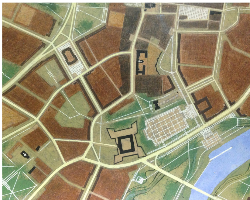
Il. 7. Plan ogólny zagospodarowania przestrzennego Rzeszowa Z. Wzorka. Założenia urbanistyczne południowej części Śródmieścia (źródło: Archiwum BRMRz)