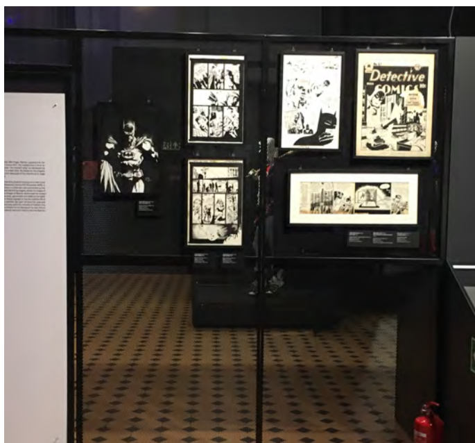
Rysunek 1. Zdjęcie przedstawia plansze komiksowe i grafiki koncepcyjne.

W centralnej części wystawy twórcy zaprezentowali oryginalne kostiumy z filmów (te, które nosili choćby Christopher Reeve, wcielający się w rolę Supermana w ekranizacji z 1978 roku, reż. Richard Donner, Lynda Carter jako Wonder Woman w produkcji z lat 70. czy Christian Bale, odtwórca roli Batmana w trylogii Mroczny rycerz , 2005–2012, reż. Christopher Nolan) oraz grafiki koncepcyjne czy szkice, które były inspiracją do ich powstania. Możliwość obcowania z oryginalnymi rekwizytami z filmów (oprócz kostiumów zobaczyć można choćby model batmobila wykorzystanego w filmie Batman: Początek [ Batman Begins , 2005]) i motocykl tytułowego bohatera z Mrocznego Rycerza [ The Dark Knight , 2008]) jest niewątpliwie ważnym przeżyciem dla fanów świata DC. Osoby, które interesują się grafiką i sztuką tworzenia komiksu, mogły dokładnie przyrzeć się zgromadzonym na wystawie pracom znanych autorów (m. in. Franka Millera, Boba Kane’a – twórcy postaci Batmana – czy Jima Lee), których w sumie jest ponad 150. Nie zabrakło również ciekawostek zza kulis superprodukcji Warner Bros – wypowiedzi twórców filmów, projektantów strojów czy scenografii (m.in. Neala Adamsa, Geoffa Johnsa czy Christophera Nolana), które zaprezentowane zostały w formie materiałów audiowizualnych, odtwarzanych w specjalnie przygotowanych,