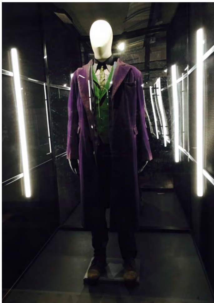
Rysunek 3. Zdjęcie przedstawia jeden z kostiumów Jokera. Autor: Anna Kuchta

z najważniejszych bohaterów DC – jak Superman, Batman czy Wonder Woman – dostał w ramach wystawy swoją przestrzeń (znajdziemy tam szkice koncepcyjne – szczególnie ciekawe są te przedstawiające pomysły finalnie niewykorzystane w filmach – kostiumy, kadry z filmów, kultowe grafiki i rekwizyty, a także krótką historię bohatera), a elementy wystawy poświęcone pozostałym – pozytywnym lub negatywnym – bohaterom (Joker, Bane czy Mr. Freeze) ułożone zostały chronologicznie według dat premier filmów produkowanych przez Warner Bros. Swój kącik mają więc bohaterowie pierwszej serii cyklu przygód Batmana (znajdziemy tam m.in. kostium Robina czy Kobiety-Kot, a także ich antagonistów: Jokera czy Mr. Freeze’a),