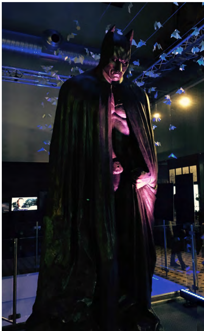
Rysunek 4. Zdjęcie przedstawia figurę zamyślonego Batmana znajdującą się w centralnej części wystawy. Autor: Anna Kuchta

Wspomnieć należy także o specyficznym polskim akcencie towarzyszącym wystawie – w specjalnie wydzielonym pomieszczeniu widzowie mogą zobaczyć okładki kultowych komiksów DC wystylizowane tak, aby przedstawiały polskie miasta. Oprócz Łodzi (Przemysław Truściński przedstawił spektakularne starcie Batmana i Jokera w – a jakże! – budynku Ec1), jest więc Warszawa (okładka autorstwa Tomasza Lareka z udziałem Batmana),