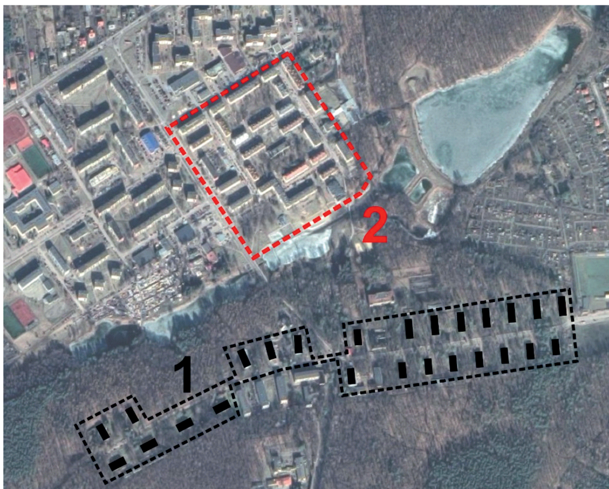
Il. 2. Policentryczny układ zespołów miejskich Poniatowej. Oznaczenia: 1 – kolonia urzędnicza i inżynierska, 2 – nowe śródmieście wybudowane w latach 50., 60. XX wieku (opracowanie własne)