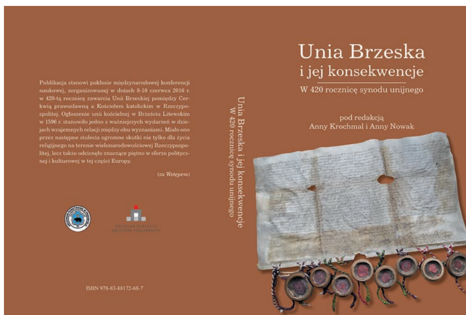
Okładka publikacji: Unia brzeska i jej konsekwencje. W 420. rocznicę synodu unijnego

lecia wywarło ono ogromny wpływ nie tylko na życie religijne na terenie wielonarodowościowej Rzeczypospolitej, lecz również wycisnęło znaczące piętno na sferze politycznej i kulturowej w tej części Europy. Unia była próbą obrony Kościoła prawosławnego w Rzeczypospolitej przed szerzącym się protestantyzmem oraz ekspansywną polityką prawosławnego patriarchatu utworzonego w 1589 r. w Moskwie. Stanowiła też dopełnienie unii politycznej zawartej w Lublinie w 1569 r. Biskupi prawosławni, podejmując świadomie i dobrowolnie decyzję o zjednoczeniu z Rzymem, zobowiązali się uznać dogmaty Kościoła katolickiego i zwierzchnictwo papieża, w zamian za co zachowali swój obrządek, kalendarz juliański i dotychczasową organizację kościelną.