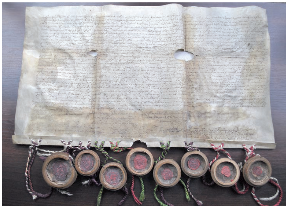
Dokument unii brzeskiej z 1596, ze zbiorów Centralnego Państwowego Archiwum Historycznego Ukrainy we Lwowie