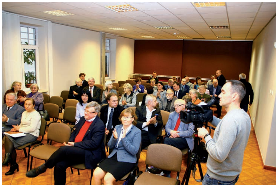
Uroczysta promocja publikacji pt. Unia brzeska i jej konsekwencje. W 420. rocznicę synodu unijnego w Archiwum Państwowym w Przemyślu

losom społeczności unickiej w czasie obu wojen światowych. Omawiano też konsekwencje kulturowe unii z 1596 r., w tym wpływ na sztukę cerkiewną na ziemiach polskich.