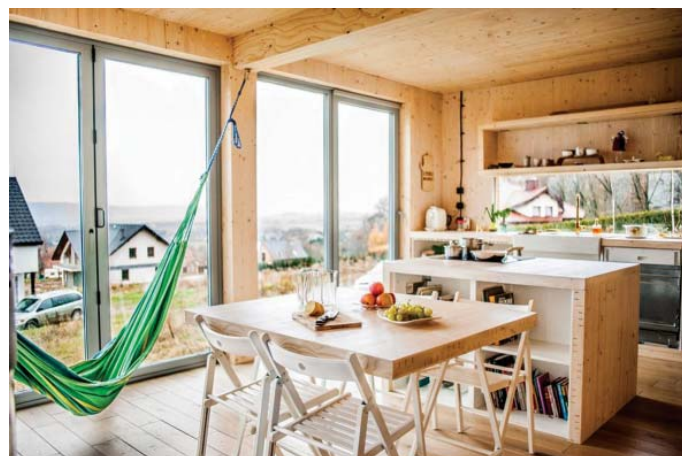
Il. 3. Widok „domu z klocków” / “House from blocks” view