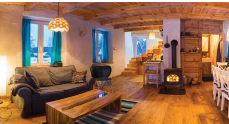
Il. 7. Dom „Dwie morgi Roztocza”, wnętrze domu, fot. M. Tabin, 2017 Ill. 7. “Dwie morgi Roztocza” house, interior, photograph by M. Tabin, 2017

samo drzewo kiedy umiera i gnije. Ta wiedza i świadoma gospodarka leśna, w tym odtwarzanie drzewostanów i sadzenie młodych drzew, które wychwytyją najwięcej CO 2 sprawia, że jest to obecnie najkorzystniejszy ekologicznie model gospodarki energetycznej.