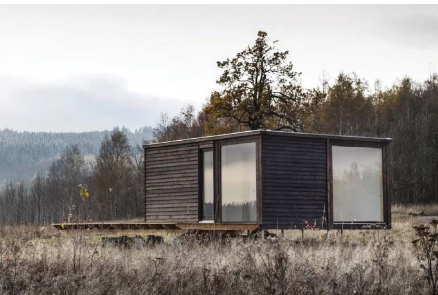
II. 1. Dom modułowy „BioDomek”, fot. M. Górka, 2018

A similar example of environmentally-friendly architecture is “Dom z klocków” [House from blocks] [ill. 3] of Maria Rauch, Zofia Rauch and Tomasz Żemojcin. The house built near Kraków, thanks to its