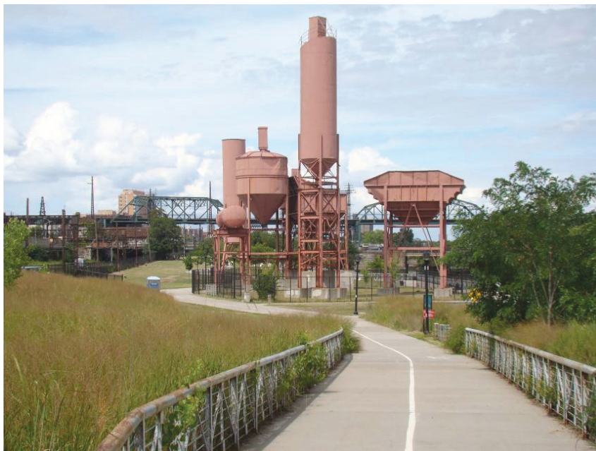
Il. 10. Infrastruktura techniczna wyeksponowana w przestrzeni parku