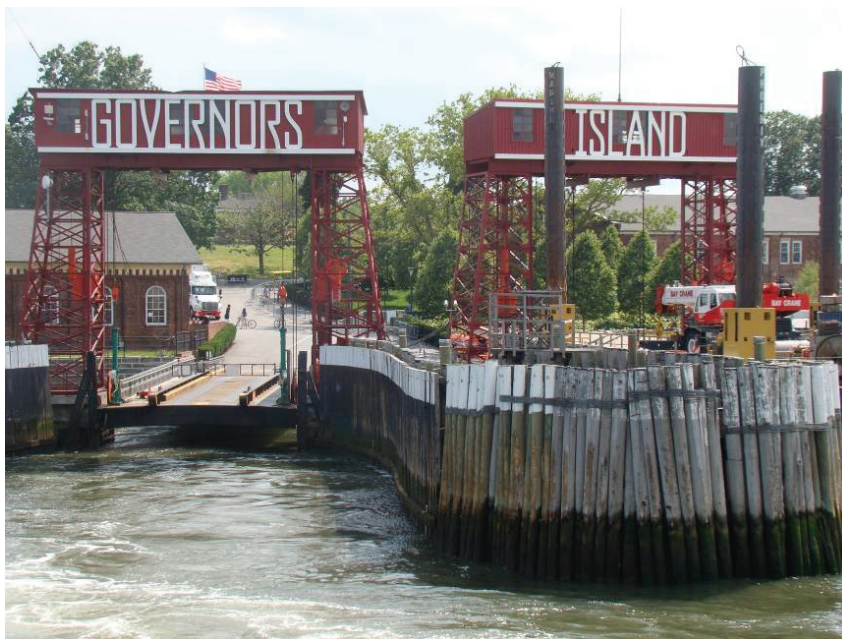
Il. 1. Przystań promowa na Governors Island