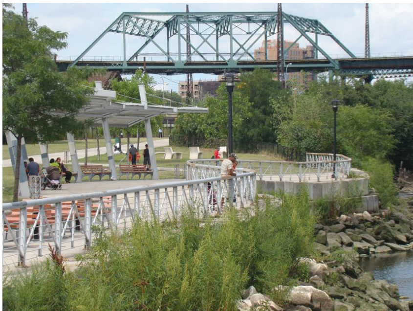
Il. 9. Nabrzeże Bronx River z elementami małej architektury