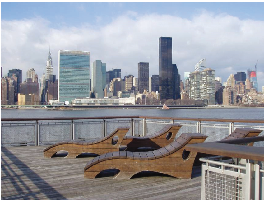
Il. 6. Sylweta Manhattanu eksponowana z pirsów rekreacyjnych