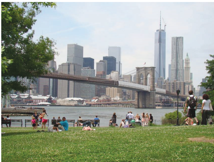
Il. 3. Rekreacyjny trawnik z widokiem na Manhattan