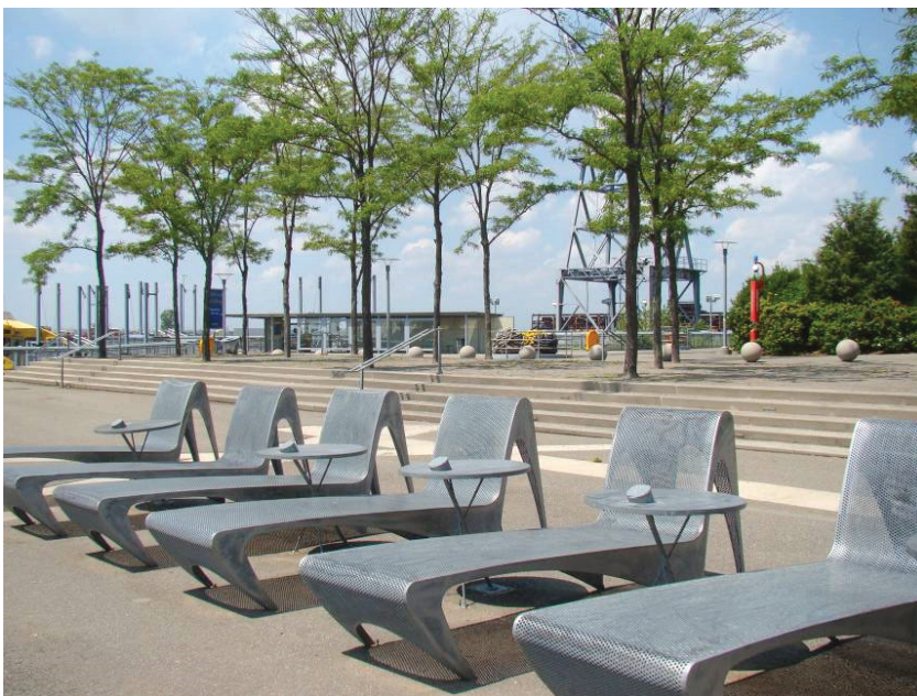
Il. 8. Stalowe szezlongi