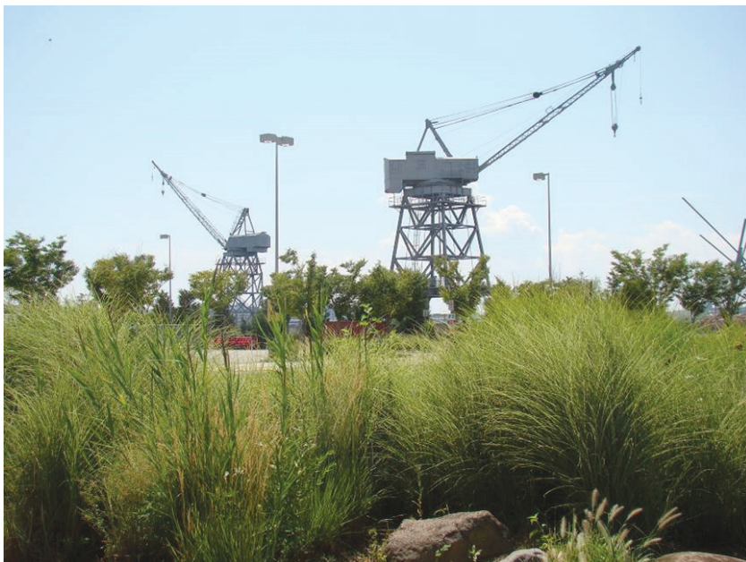
Il. 7. Żurawie portowe dawnej stoczni remontowej