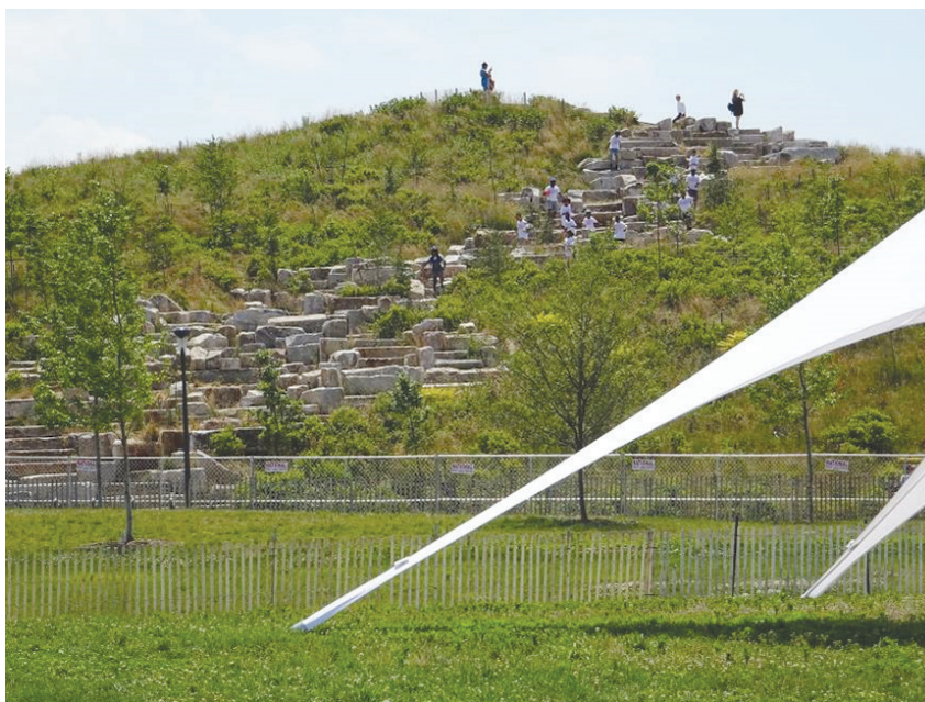
Il. 2. Ukształtowane wzniesienia terenowe