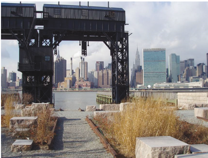
Il. 5. Historyczne suwnice będące świadectwem tradycji miejsca