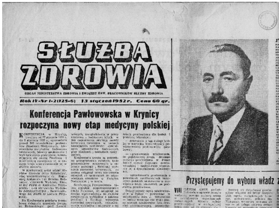
Fot. 1. Strona tytułowa czasopisma „Służba Zdrowia”, 1952 r.

czaj zajmowały całą szpaltę czasopisma 63 . Zamieszczano tzw. artykuły programowe, omawiające przykładowo życie i działalność przywódcy Związku Radzieckiego Józefa Stalina. Podobnie rzecz wyglądała w przypadku czasopisma „Służba Zdrowia” wydawanego od 1949 r. Powszechnie było wówczas promowanie sowieckiej służby zdrowia 64 . Spośród ludzi nauki najczęściej przywoływano postać wspomnianego