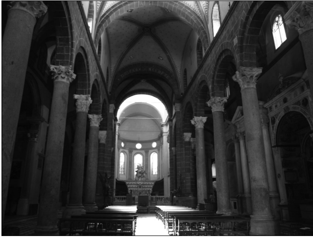
Il. 5. Genua, kościół Santa Maria di Castello, zbudowany w XII–XIII wieku, wewnątrz