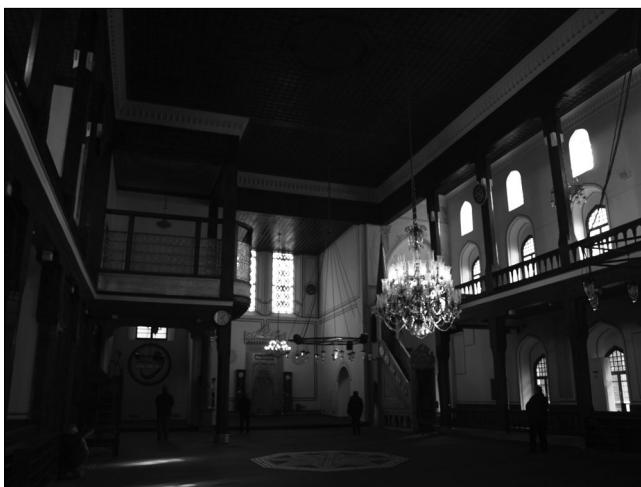
Il. 2. Stambuł, dawna Pera, poddominikański kościół św. Pawła, obecnie meczet Arap Camii, zbudowany w pierwszej ćwierci XIV wieku, kilkakrotnie przebudowany i odnawiany od XVI wieku, widok wnętrza w kierunku wschodnim