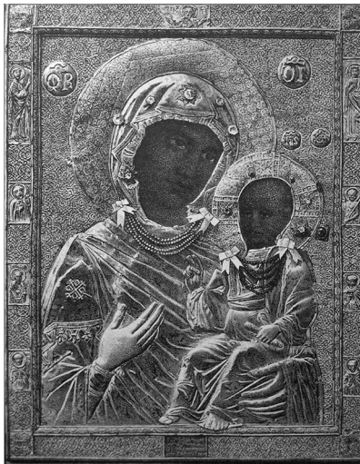
Il. 6. Madonna di Pera w metalowej sukience (koniec XIII – pierwsza ćwierć XIV wieku?) z kościoła Santa Maria di Castello w Genui, zniszczona w 1878 roku