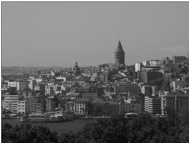
Il. 1. Stambuł, widok z pałacu Topkapı na Złoty Róg i dawną Perę