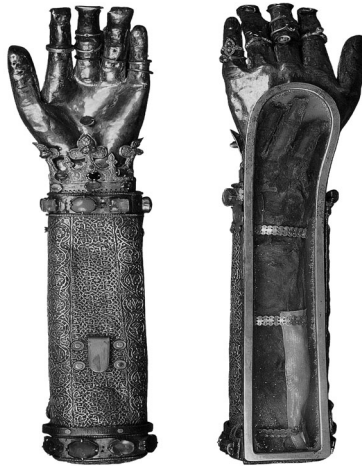
Il. 8. Relikwiarz św. Anny (początek XIV wieku?), widok z obu stron; Genua, Tesoro del Duomo (przedruk za: G. Ameri, Reliquiario del braccio di Sant'Anna , s. 254)