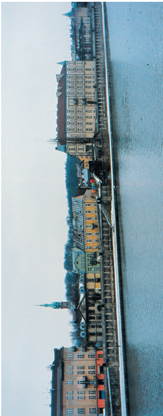
II. 7. Widok historycznego fragmentu Podgórze