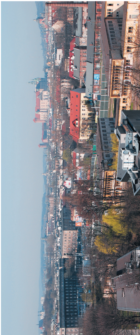
II. 9. Widok z okna – fragment panoramy Krakowa zwieńczonej dominantą Wawelu