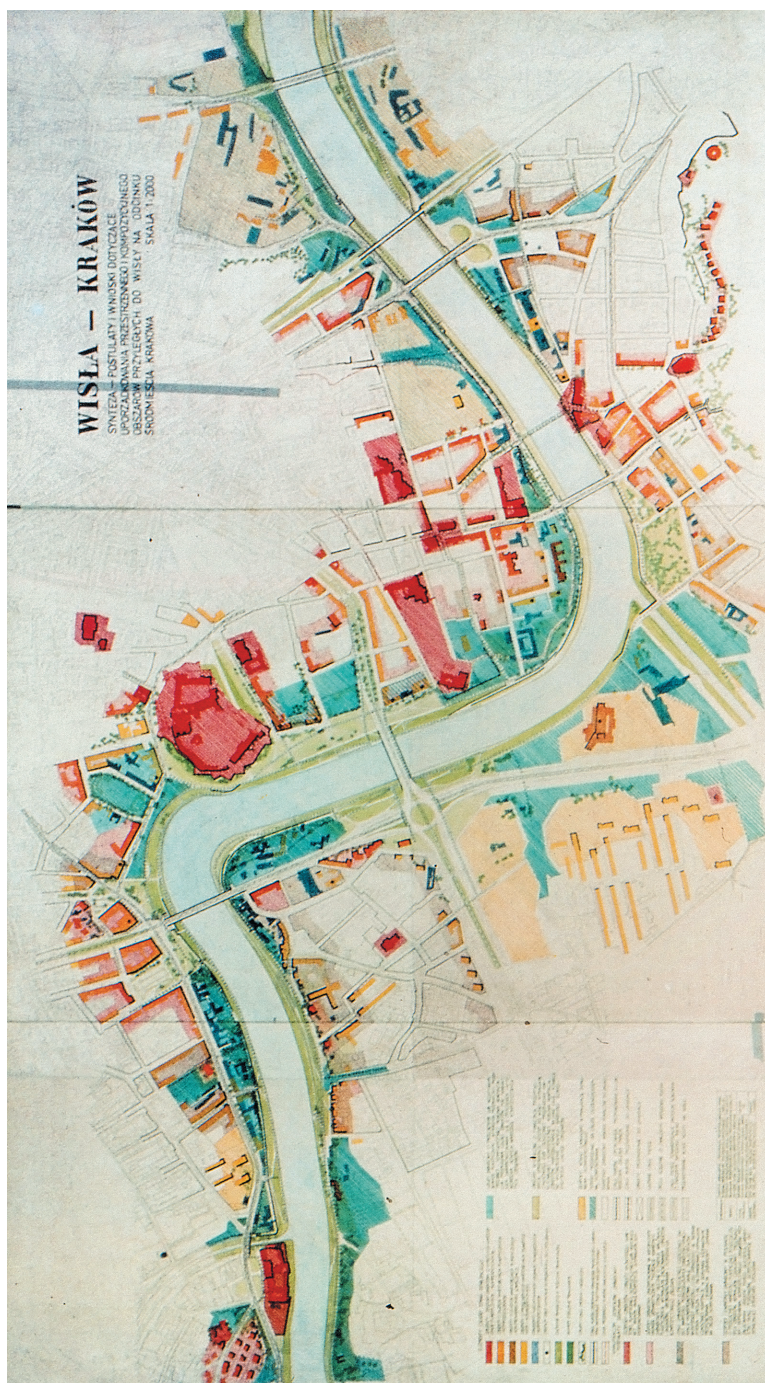
Il. 6. „Studium walorów widokowych otoczenia Wisły w Śródmieściu Krakowa” – plansza wniosków