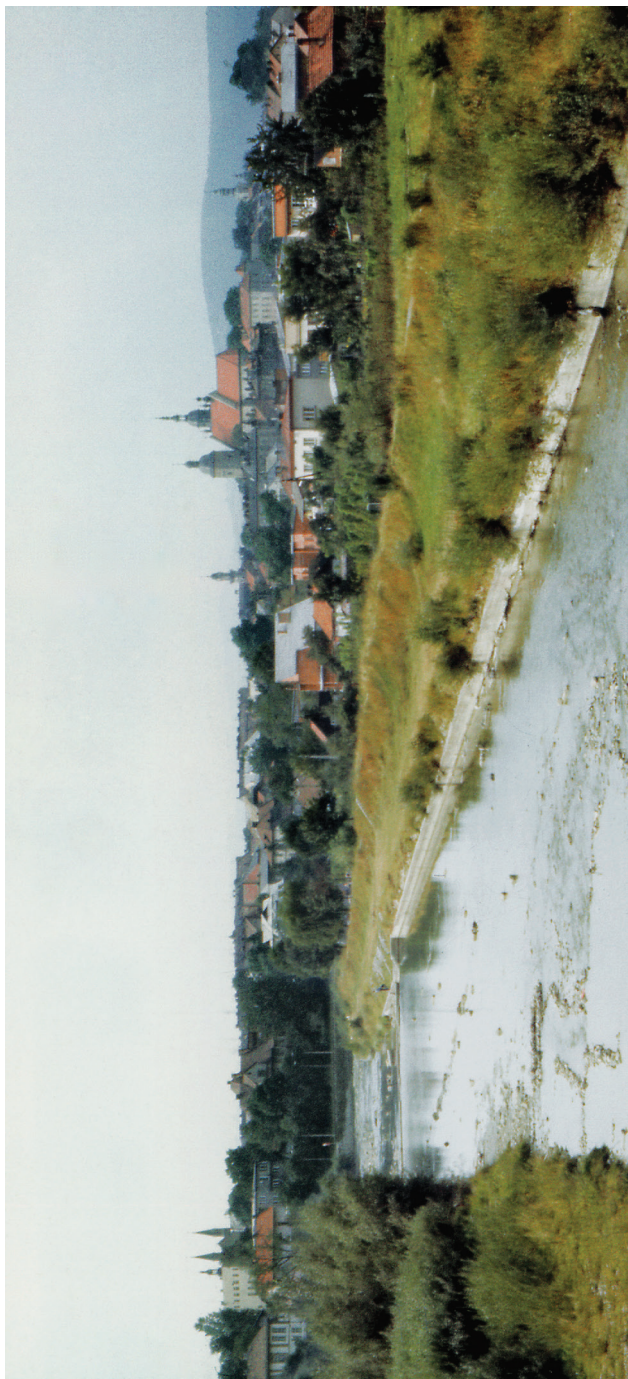
II. 2. Nowy Sącz – widok Starego Miasta