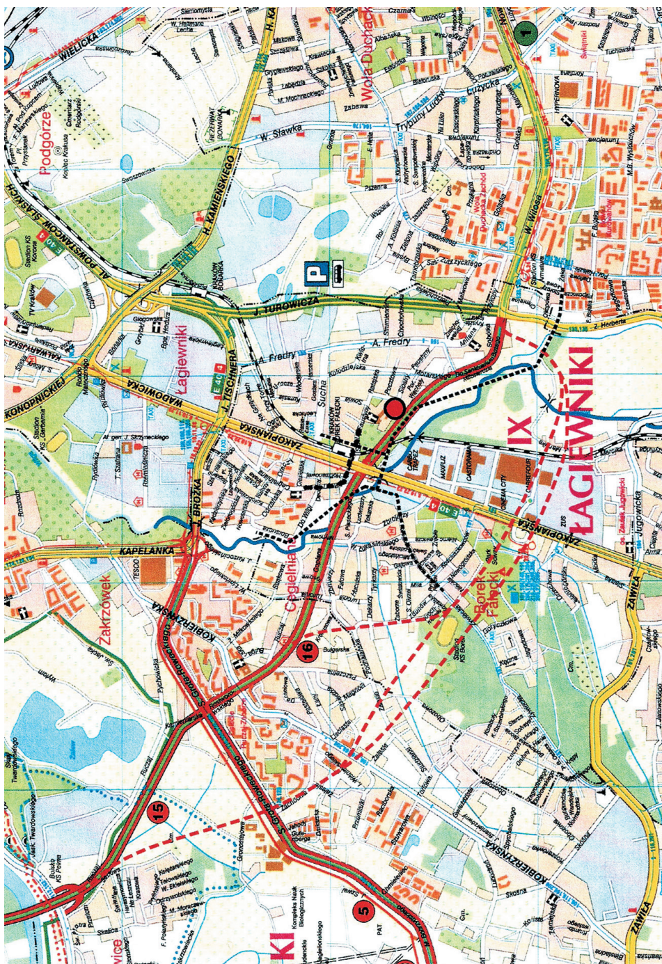
Il. 8. lagiewniki – otoczenie Sanktuarium Bożego Miłosierdzia