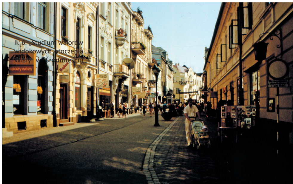
II. 3. Nowy Sącz – widok ulicy Jagiellońskiej