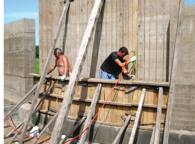
Il. 5. Wykonywanie ściany z ziemi ubijanej w szalunkach, 2007. Ściana krzywoliniowa, szalunki z desek pionowych. (fot. J. Górski) / Making a rammed earth wall in formwork, 2007. Wall is curved, formwork out of vertical planks. (photo: J. Górski)

The thermal balance was prepared in accordance with the algorithm contained in Annex G to Polish Standard PN-B-02025:1999 (item 3), supplemented by a module calculating heat losses from floor at ground level (according to ITB Instruction (item 5/)). The calculations were made using the UbE computer software, which was based on this algorithm. The efficiency of the use of solar heat (veranda and south-eastern windows) obtained by the building was calculated using the PREFEN 1.0 program owned by the Faculty of Architecture of the Warsaw University of Technology (the calculations were made by arch. Paulina Gawrońska from the sub department of Building Physics ).