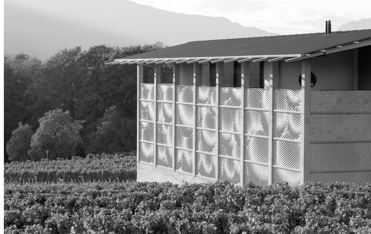
Il. 6. Winiarnia Gantenbein w Fläsch (Szwajcaria) / Gantenbein Winery in Fläsch (Switzerland)

Another example of using natural building materials is the Domaine Les Aurelles winery in Nizas, France. It was built entirely of solid limestone from