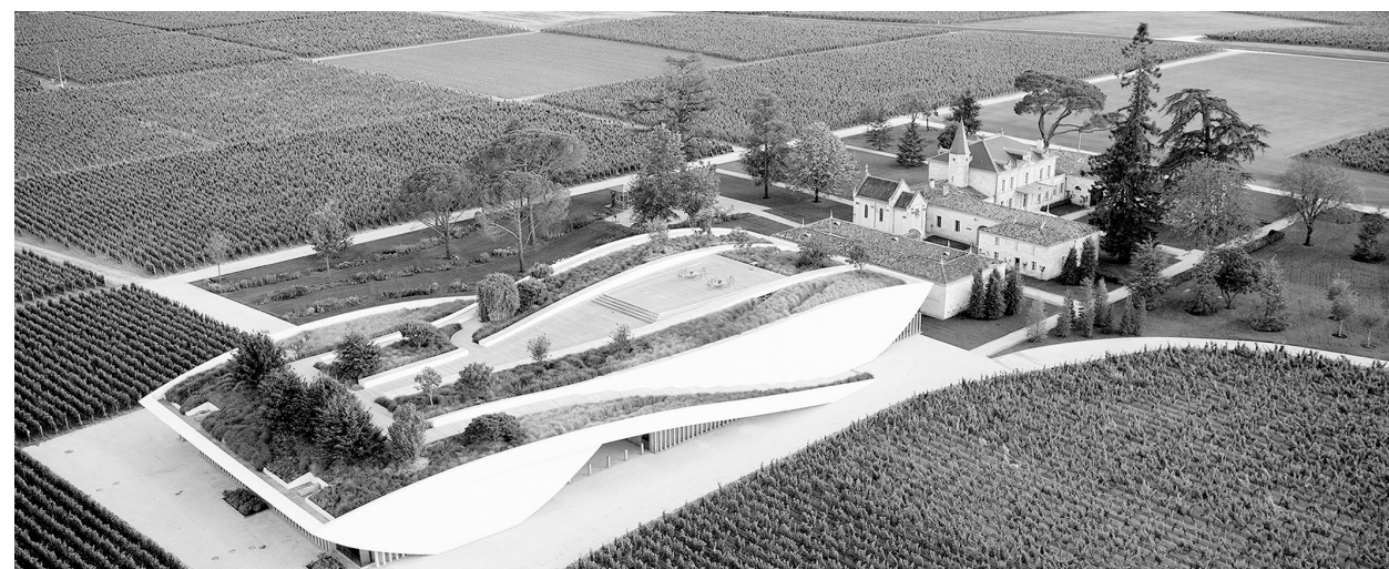
Il. 3. Winiarnia Château Margaux (Francja) / Château Margaux Winery (France)