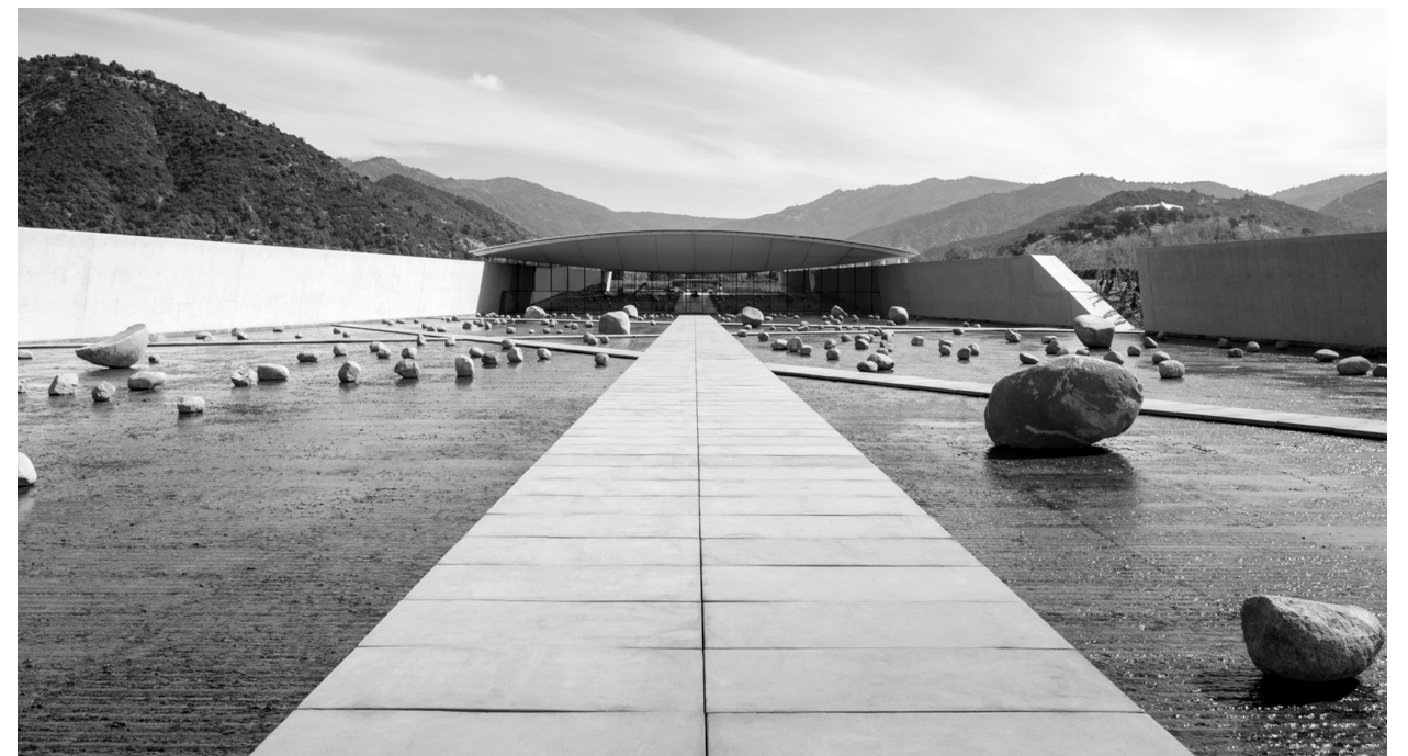
Il. 1. Cantina Vinicola w Bargino (Włochy) / 1 Cantina Vinicola in Bargino (Italy)