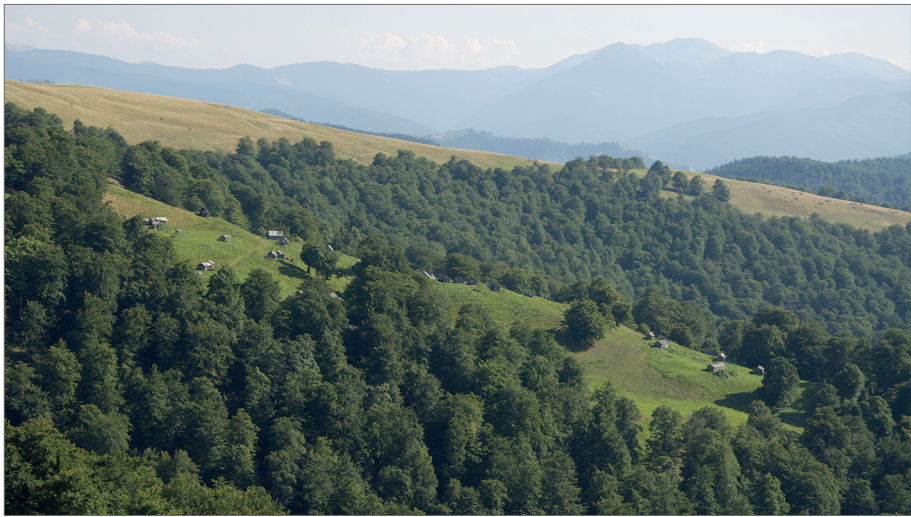
Fot. 3. Jedno z komunalnych gospodarstw bydłowych Czarnohory, stan w sezonie 2010. Widoczne liczne obory należące do poszczególnych rodzin gromady Kwasy Photo 3. One of the communal cattle farms in the Chornohora, in 2010. View of numerous small barns built by families from the Kwasy community