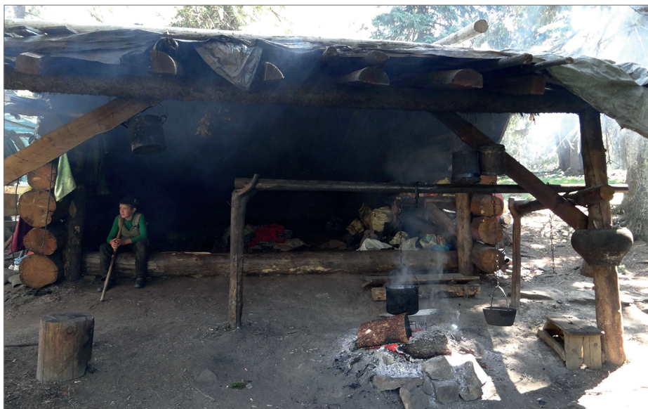
Fot. 2. Jedno z kilku prymitywnych gospodarstw owczych Czarnohory, prowadzone przez pasterzy z gromady Bogdan. Widoczny jedyny szałas mieszkalny pasterzy i miejsce wyrobu sera, stan w sezonie 2013 (strefa krajobrazów antropogenicznych KRB)

Photo 1. Sheep grazing on a subalpine pasture in the Chornohora in 2009 (buffer zone, CBR)