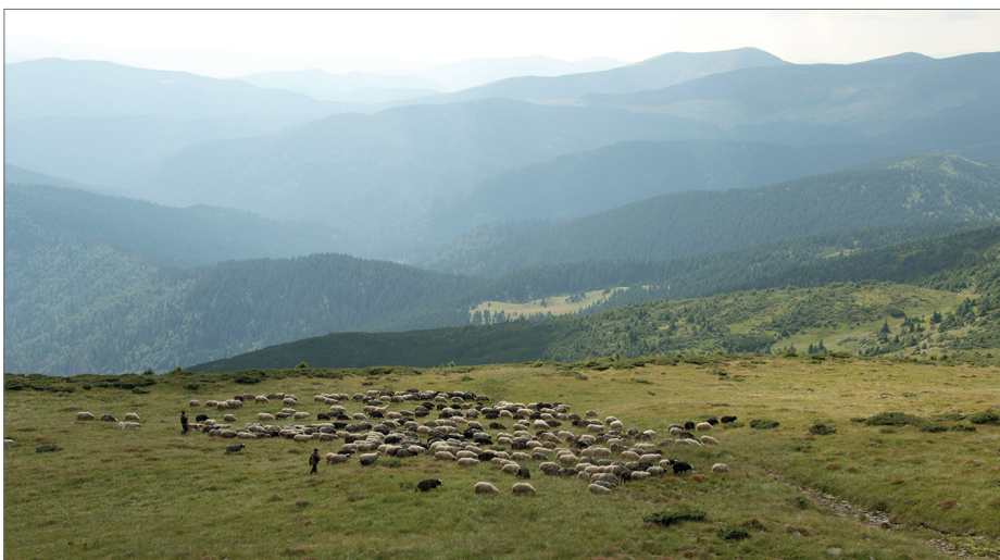
Fot. 1. Wypas owiec na jednej z subalpejskich połonin Czarnohory w sezonie 2009 (strefa buforowa KRB)

Photo 1. Sheep grazing on a subalpine pasture in the Chornohora in 2009 (buffer zone, CBR)