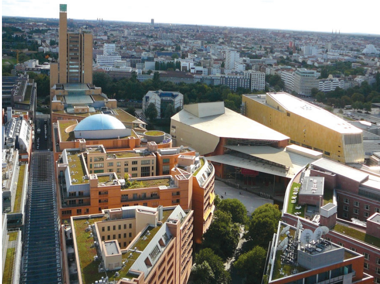
II. 1. Widok na Potsdamer oraz plac Marleny Dietrich

III. 1. View of Potsdamer and Marlena Dietrich square