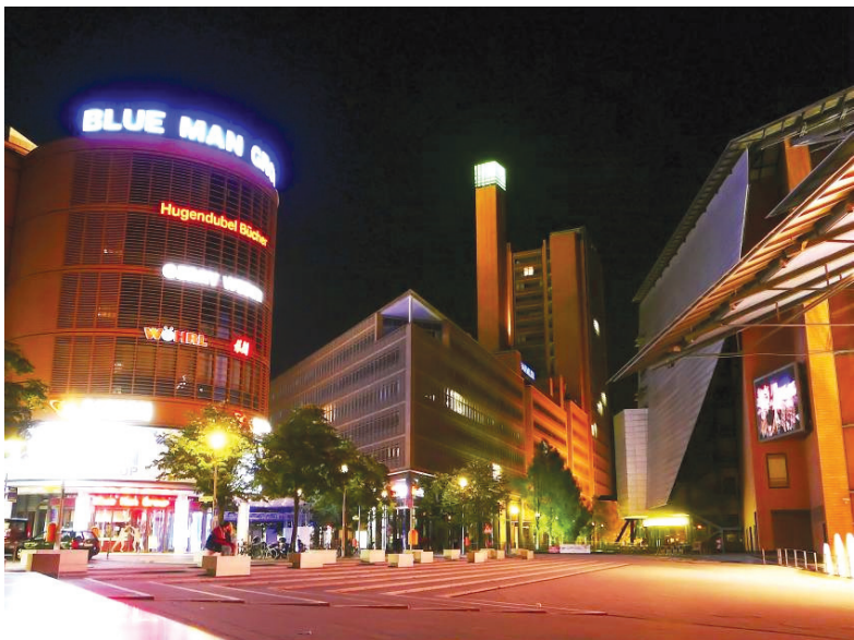
II. 2. Widok na plac Marleny Dietrich od strony założenia wodnego, zaprojektowany jako plac miejski (fot. Katarzyna Zawada-Pęgiel, 2010)

III. 1. View of Potsdamer and Marlena Dietrich square