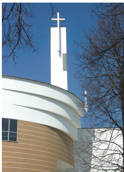
II. 10–14. Łęki Górne – kościół pw. Chrystusa Króla