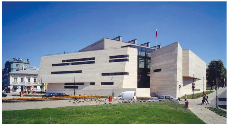
II. 6–7. Muzeum Narodowe Ziemi Przemyskiej