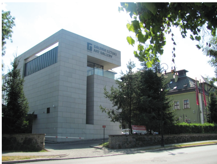
II. 8–9. Galeria Sztuki Współczesnej przy MCK „Sokół” w Nowym Sączu