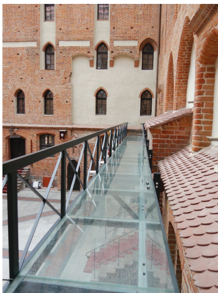
II. 3–5. Rewaloryzacja Zamku Krzyżackiego w Gniewie