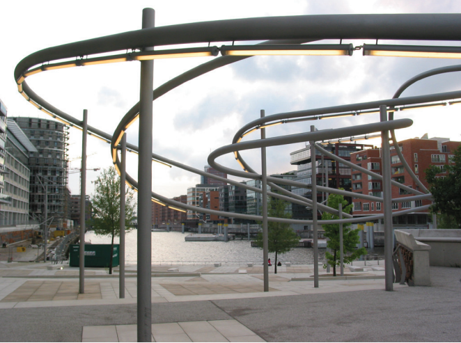
il. 12. Zespół Hafencity, Hamburg, fot. K. Pluta 2008 / Hafencity, Hamburg, photo K. Pluta 2008 il. 13. Jungfernstieg, Hamburg, fot. K. Pluta 2008 / Jungfernstieg, Hamburg, photo K. Pluta 2008