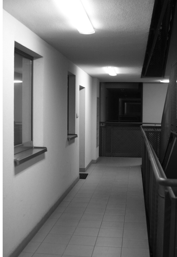
il. 2. Budynek przy ul. J. Piltza. Klatka schodowa. (autor: Karolina Warzocha) / Apartment block at J. Piltza Street. Staircase. (author: Karolina Warzocha)