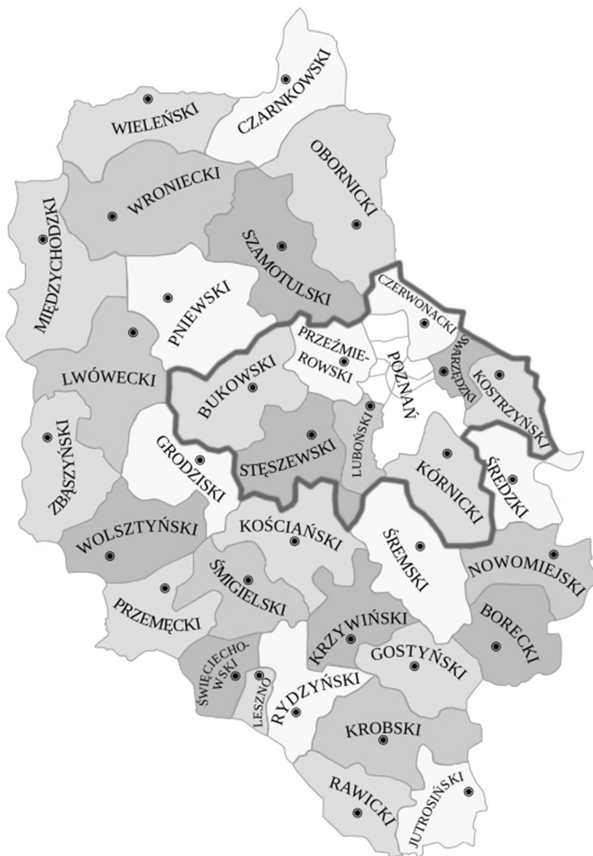
Ryc. 2. Położenie dekanatów uwzględnionych w badaniu empirycznym w granicach archidiecezji poznańskiej