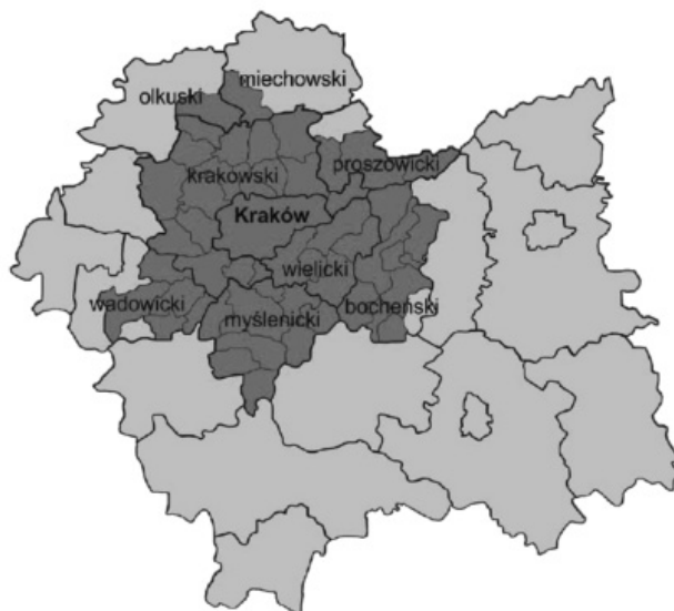
Rysunek 1. Delimitacja Krakowskiego Obszaru Metropolitalnego zawarta w Planie Zagospodarowania Przestrzennego Województwa Małopolskiego