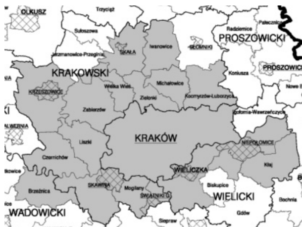
Rysunek 3. Delimitacja Krakowskiego Obszaru Metropolitalnego zawarta w Małopolskim Regionalnym Programie Operacyjnym na lata 2007–2013