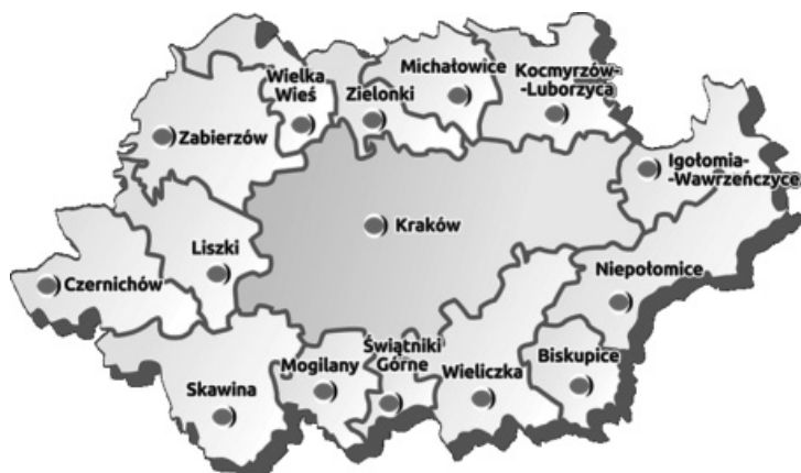
Rysunek 4. Delimitacja Krakowskiego Obszaru Metropolitalnego zawarta w projekcie Strategii Zintegrowanych Inwestycji Terytorialnych dla Krakowskiego Obszaru Funkcjonalnego