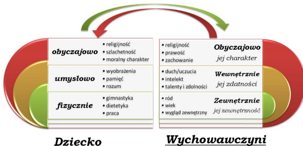
Rys. 2. Wzajemność wpływu podmiotów wychowania.

Ochroniarki zaangażowane w wychowanie dzieci zobowiązała również, aby swoim życiem uświadamiały matkom, dziewczętom, kobietom ich rolę oraz godność. Nie tylko Bojanowski, ale i jemu współcześni myśliciele, a także społecznicy upatrywali w zaangażowaniu w wychowanie na rzecz niepodległej Ojczyzny kobiet–matek, świadomych obywaterek skuteczną drogę odrodzenia narodu. Realizacja tego zamiaru wymagała jasnych podstaw filozoficznych, religijnych i społeczno-kulturowych, na których budowano stałe, systemowe rozwiązania odpowiadające naturze i kulturze osób, rodzin, ludu oraz narodu.