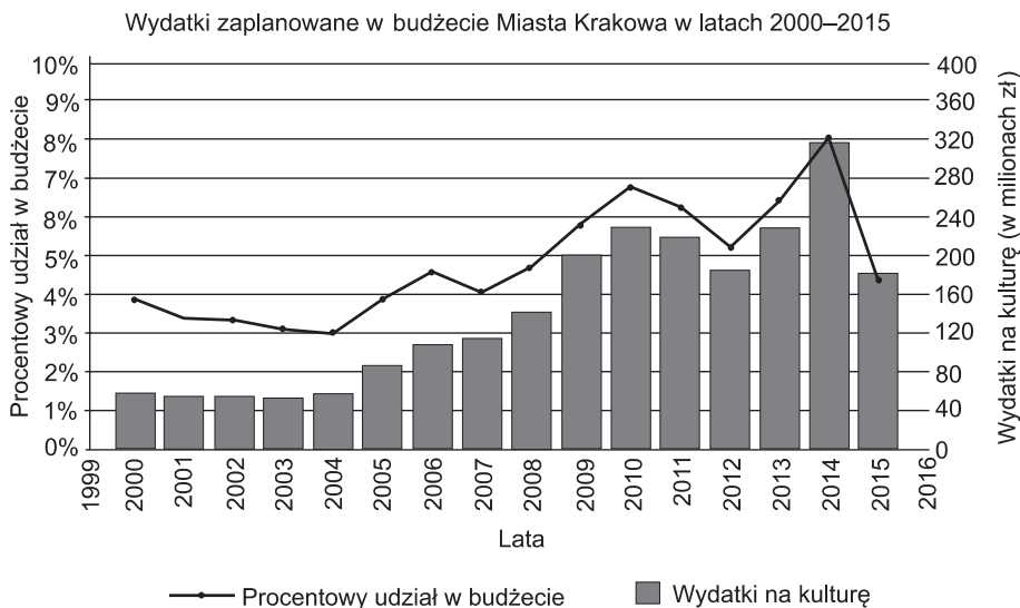
Rysunek 1. Środki przeznaczone na kulturę oraz procentowy udział środków przeznaczonych na kulturę w stosunku do całego budżetu miasta Krakowa