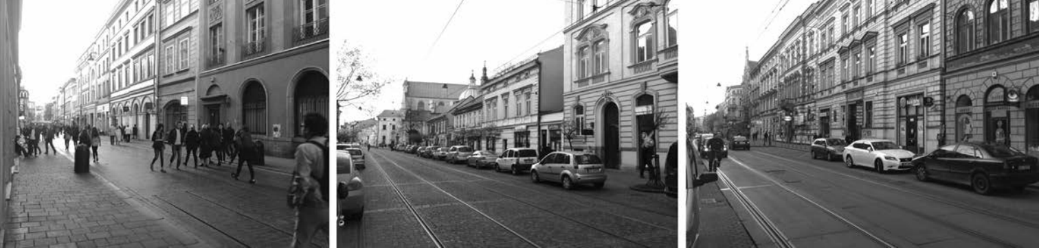
il. 1. Zabudowa ulicy Szewskiej i Karmelickiej swoją zróżnicowaną formą architektoniczną i bogatym detalem przykuwa uwagę przechodnia, a znajdujące się w pierzejach i na zamknięciach perspektywicznych charakterystyczne budynki (Teatr Bagatela, Kościół oo. Karmelitów czy Kamienica pod Pająkiem) stanowią istotne punkty orientacyjne w przestrzeni miasta / The frontage developments of ul. Szewska and ul. Karmelicka tend to capture the attention of any passers-by through their perceptibly diversified architectural form and a multitude of ornamental details, while the characteristic buildings located either directly within them, or serving as the visual closures of the entire axial perspective (i.e. Bagatela Theatre, Carmelite church, House under the Spider) act as vital landmarks effectively aiding navigation through the city maze

się tendencje urbanistyczne i architektoniczne ostatnich przeszło 750 lat. A tworzące ten ciąg czasoprzestrzenny 21 układy pomimo swojego zróżnicowania formalnego, a może właśnie dzięki niemu, stanowią czytelną i atrakcyjną dla pieszego przestrzeń.