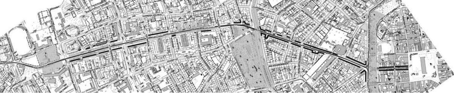
il. 3. Schemat pokazujący system zieleni wraz z występowaniem funkcji handlowo – usługowych w parterach. Zauważyć można, że poczucie ciągłości przestrzeni uzyskać można dzięki naprzemiennemu zastosowaniu wspomnianych elementów, a ich równoczesne zastosowanie może znacząco wpłynąć na wzmocnienie tego odczucia / The contour map depicts the system of city greenery, in conjunction with the commercial functionality of the ground floor premises. It demonstrates that a sense of spatial continuity may effectively be ensured through an alternate application of those components, whereas their simultaneous application may have it tangibly enhanced

Stojące u wylotu ulicy Królewskiej wspomniane szpalery drzew kierują wzrok przechodnia ku dominującemu w zamknięciu perspektywicznym ulicy budynkowi Biprostalu. Zmierzając w jego kierunku zauważyć można odmienny w stosunku do ulicy Karmelickiej charakter ulicy Królewskiej. Jej przekrój jest znacznie szerszy dzięki czemu możliwe było m.in. wprowadzenie wspomnianej zieleni kompozycyjnej.