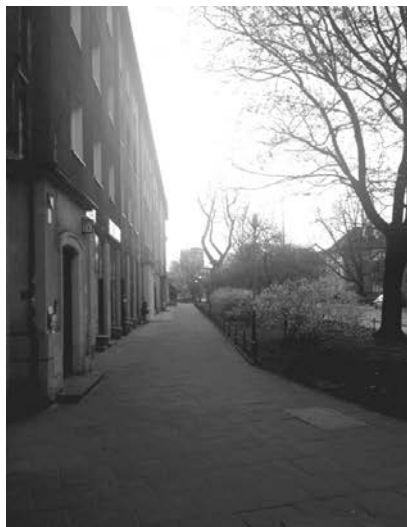
il. 4. Na zdjęciach zauważyć można jak w przestrzeni ulicy Królewskiej, na całej jej długości dominuje sylwetka biurowca Biprostal, a także jak zlokalizowane w parterach lokale handlowo – usługowe prowadzą pieszego w jej kierunku / The entire length of ul. Krolewska street seems visually dominated by the imposing silhouette of the BIPROSTAL office block, whilst the retail outlets accommodated on the ground floors of the buildings naturally guide the pedestrian traffic towards it

This place is rather special for many reasons. Very much like the areas closely associated with the Bagatela Theatre and Plac Inwalidow square, respectively, this one also straddles the junction of vital city transport routes (i.e. an intersection of