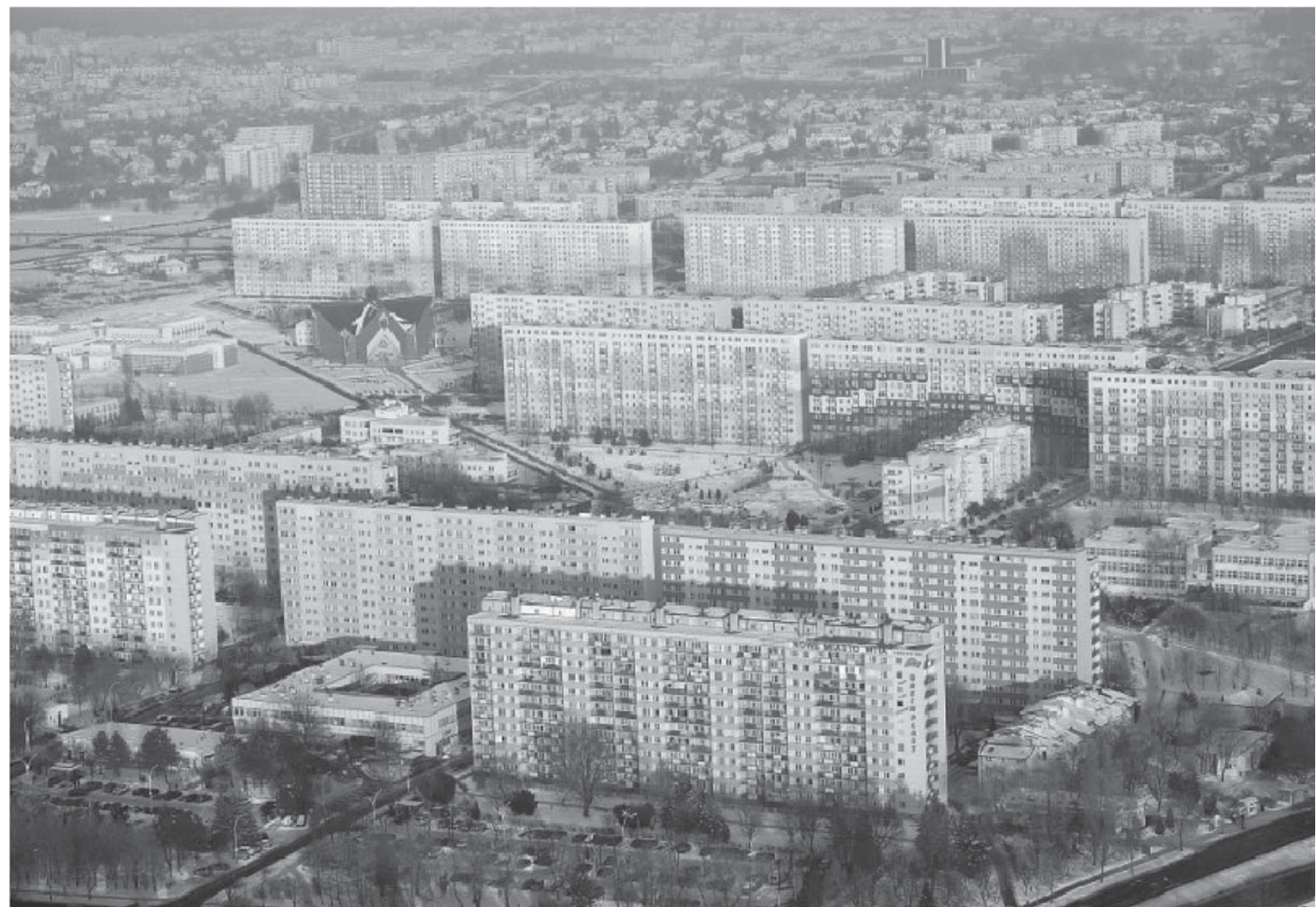
il. 5. Zabudowa Osiedla Nowe Miasto poddana termomodernizacji. / Development of the Nowe Miasto housing estate subjected to thermo-modernisation.

Przemiany struktury przestrzennej osiedla od początku lat 90. Model osiedla stworzonego w oparciu o wielkogabarytową wysoką zabudowę wielorodzinną stał się polem interwencji już w latach 80. Wśród zabudowy wysokiej zaczęły pojawiać się budynki mieszkalne wielorodzinne o wysokości czterech kondygnacji. Powstawała również zabudowa jednorodzinna jak ciąg budynków szeregowych na skarpie przy ul. Podwiślocze.