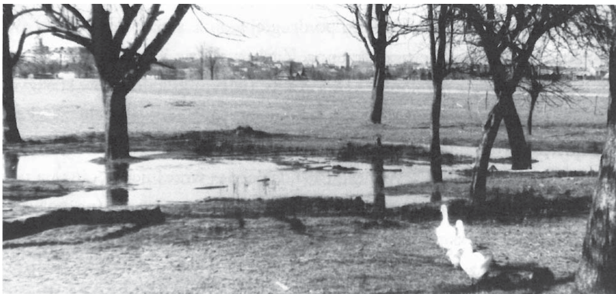
il. 2. Widok terenu przyszłej dzielnicy Nowe Miasto – stan z około 1960 r. [za:] Hennig Władysław, Rzeszowski alfabet miejsc często już zapomnianych i osób z nimi związanych, Rzeszów, 2012, s. 218 / The view of the prospective area of the Nowe Miasto district – circa 1960. [after:] Hennig Władysław, Rzeszowski alfabet miejsc często już zapomnianych i osób z nimi związanych, Rzeszów, 2012, p. 218