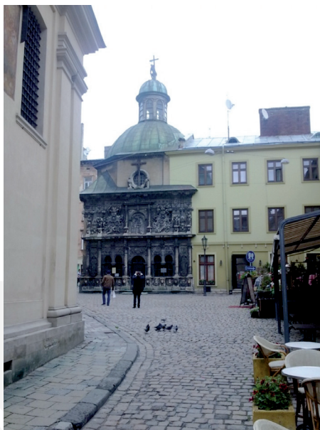
III. 1. Lviv, Cathedral Square. View of the Boim Family Chapel.