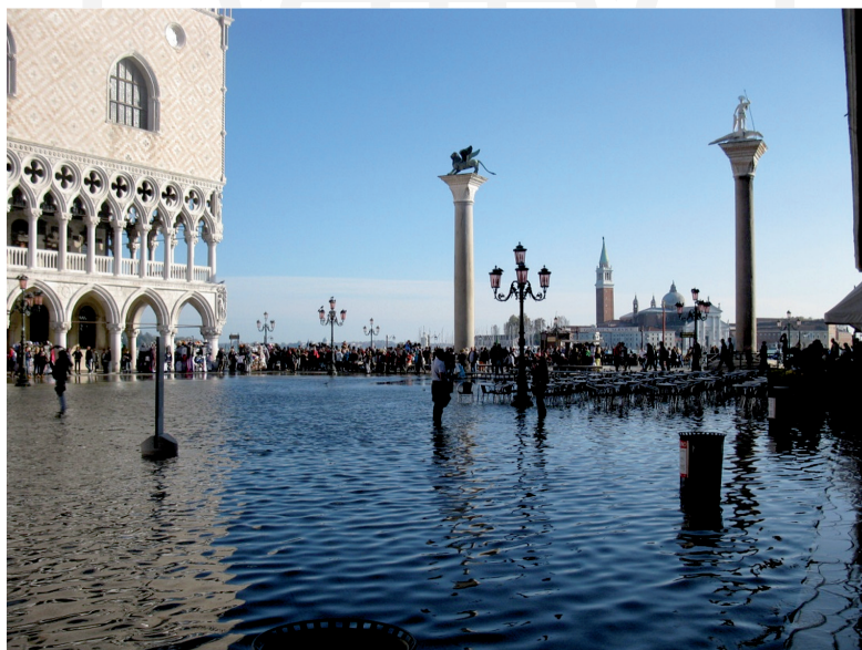
III. 8. Venice. The Piazzetta underwater. View of the columns of St. Mark and St. Theodore.