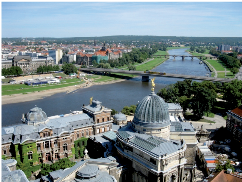
III. 5. Dresden. View a fragment of the city centre located near the Elbe river.