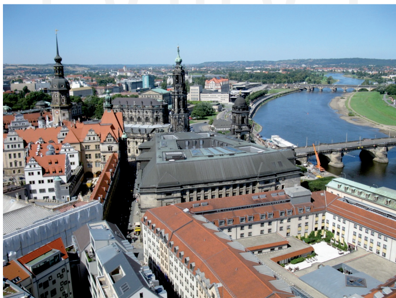
III. 6. Dresden. View in the direction of the Castle Square.