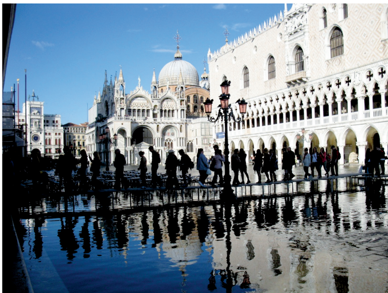
III. 7. Venice. St. Mark's Square during the Aqua Alta.