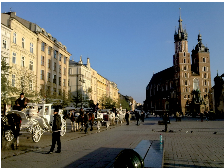
III. 3. Krakow. Main Market Square. View of St. Mary's Church..