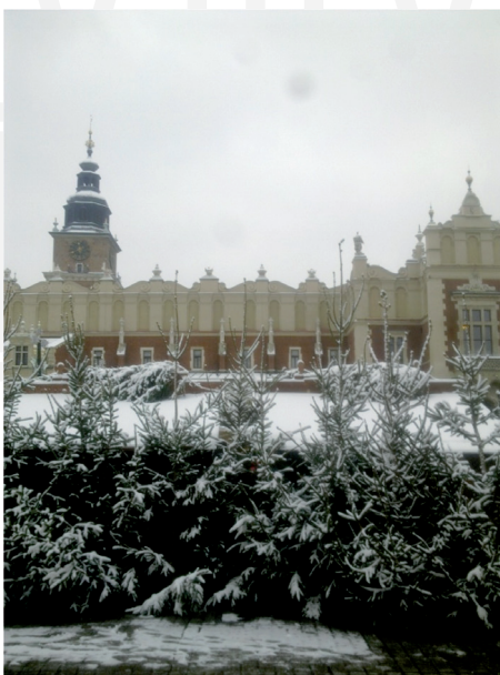
III. 2. Krakow. Main Market Square. winter fair before Christmas.