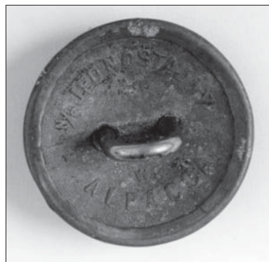
Il. 10. Guzik mundurowy (rewers), tzw. duży (wzór 1928), Polska, firma B.R.W., przy płaszczu F.X. Pusłowskiego, Muzeum Uniwersytetu Jagiellońskiego.