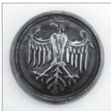
Il. 11. Guzik mundurowy nieregularny (awers) według wzoru Armii Polskiej we Francji, firma A.U., Wiedeń, 1918–1927, przy płaszczu F.X. Pusłowskiego, Muzeum Uniwersytetu Jagiellońskiego.