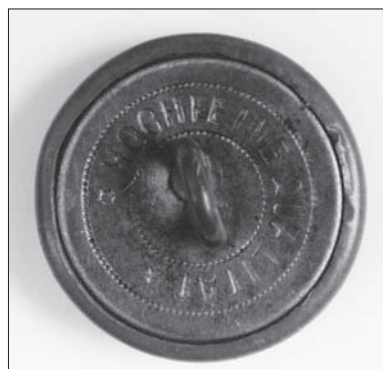
Il. 6. Guzik mundurowy (rewers), tzw. duży (wzór 1917), Austria (?), przed 1923 r., przy płaszczu F.X. Puśłowskiego, Muzeum Uniwersytetu Jagiellońskiego.