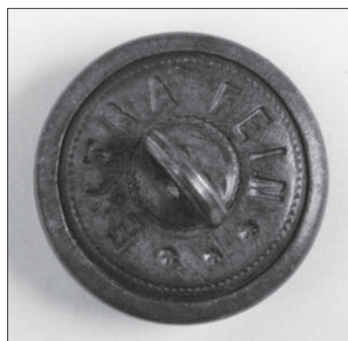
Il. 8. Guzik mundurowy (rewers), tzw. mały (wzór 1917), Austria (?), przed 1923 r., przy płaszczu F.X. Puśłowskiego, Muzeum Uniwersytetu Jagiellońskiego.