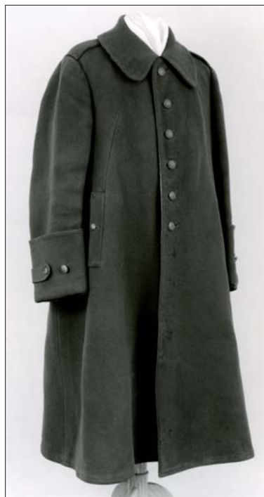
Il. 1. Płaszcz oficerski F.X. Puśłowskiego, M. Spinka, Warszawa, 1923, widok z ¾, Muzeum Uniwersytetu Jagiellońskiego.