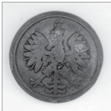
Il. 9. Guzik mundurowy (awers), tzw. duży (wzór 1928), Polska, firma B.R.W., przy płaszczu F.X. Pusłowskiego, Muzeum Uniwersytetu Jagiellońskiego.