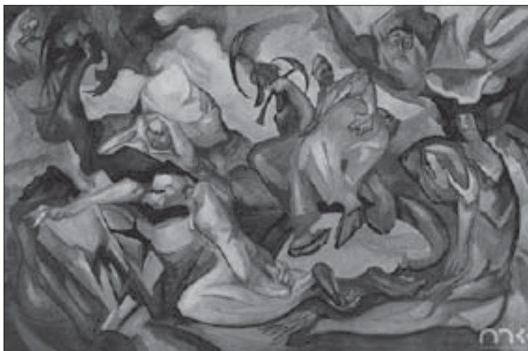
Il. 1. Stanisław Ignacy Witkiewicz, Kompozycja. Walka (około 1920). Muzeum Narodowe w Kielcach